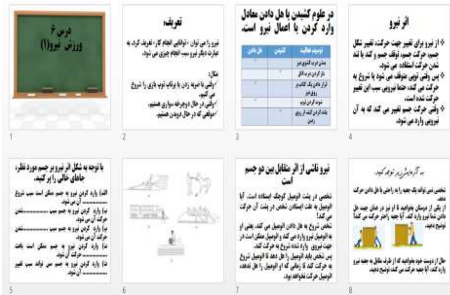
شکل ۲. ارائه خطی و نرم افزار PowerPoint (نمونه‌ی استفاده شده)

با توجه به مطالبی که در بالا ذکر شد می‌توان اظهار داشت که ارائه شبکه‌ای در مقایسه با ارائه خطی بر پیشرفت تحصیلی علوم تجربی ششم ابتدایی مؤثر است. این پژوهش بر آن است که این ادعا را مورد بررسی قرار دهد. بنابراین سوال اصلی پژوهش مورد نظر این است که آیا ارائه شبکه‌ای در مقایسه با ارائه خطی بر پیشرفت تحصیلی علوم تجربی ششم ابتدایی اثربخش‌تر است؟ به این منظور ۳ فرضیه مورد مطالعه قرار گرفت که ارائه شبکه‌ای در مقایسه با ارائه خطی بر پیشرفت تحصیلی مفاهیم علوم تجربی ششم ابتدایی ( یادداری، درک و کاربرد) مؤثر است که در قسمت یافته‌ها به آن‌ها اشاره شده است.