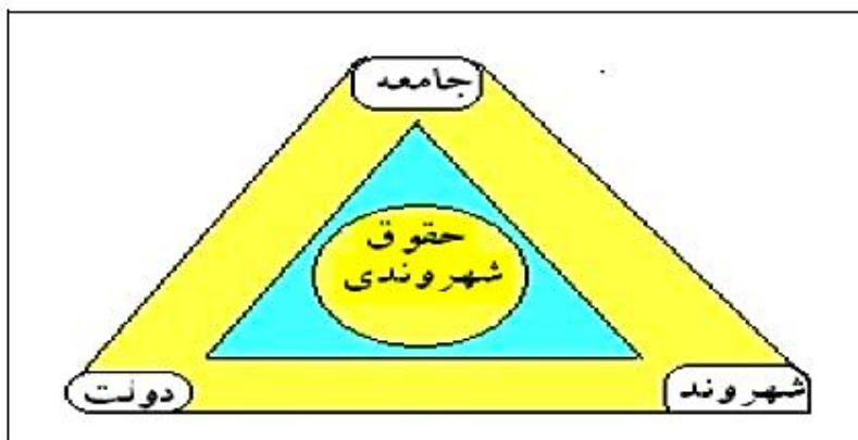
عناصر دخیل در تاسیس، ترسیم و شناخت حقوق شهروندی