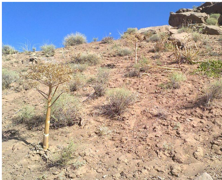
تصویر ۲- کما کوهستانی در مرحله رکود