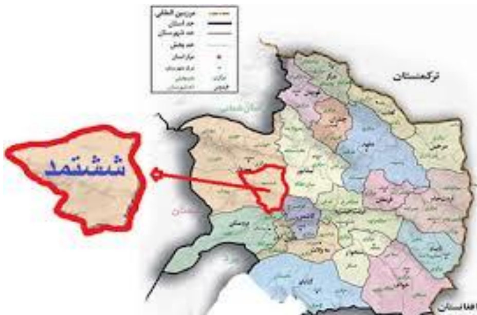
نقشه ۱- موقعیت میدان مورد مطالعه در استان خراسان رضوی