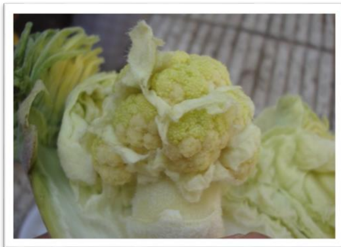
تصویر ۳- گل نارس گیاه کما