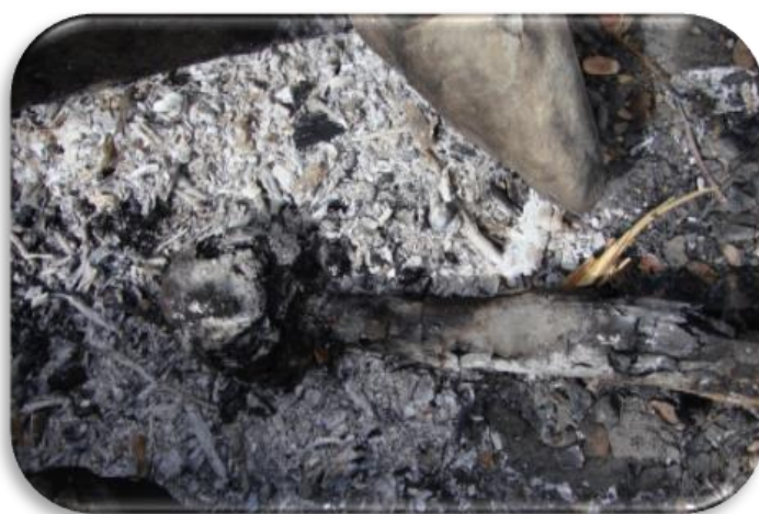
تصویر ۶- کمای آتشی

مردم منطقه آن را برای کمای آتشی یا زیر آتشی ترجیح می‌دهند. در این مورد کمای به اصطلاح قُرنه را بعد از آنکه برگ‌هایش را جدا کردند، بدون آنکه پوسته و قسمت کلاهکی و چتری آن را حذف کنند به درون آتش می‌اندازند تا بریان شود. بسته به میزان شعله آتش گیاه بریان می‌شود.