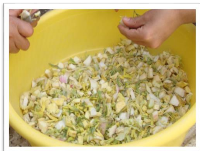
تصویر ۴- کما خرد شده