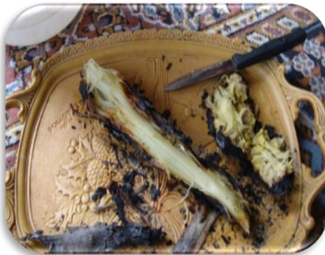
تصویر ۷- کما آتشی

یکی از وظایف و کارهای زنان روستاهای منطقه به‌ویژه در گذشته و البته حال پخت نان مورد نیاز خانه و خانواده است که معمولاً هر دو هفته‌ای یکبار مباردت به انجام این کار می‌کنند. عمل نان پختن در منطقه به «خمیر کردن» معروف و مصطلح است. در روزهایی که خانواده در اصطلاح محلی خمیر دارند در تنور آخر که دیگر کار پخت نان به پایان رسیده است، هنوز تنور از آتش و خاکسترهای نیمه‌جان گرم است، در این موارد در اوایل فصل بهار که این گیاه در دسترس مردم است آن را به درون تنور می‌اندازند و روی آن را با همان خاکستر نیمه‌جان که به آن در اصطلاح محلی خوریج ۱ می‌گویند، پوشانده، منتظر می‌مانند تا گیاه بریان شود. از تکنیک آتشی کردن کما، چوپانان منطقه نیز در بیابان استقبال می‌کنند. آن‌ها معتقدند به علت آب موجود در ساقه این گیاه، تشنگی آن‌ها در حد زیادی با مصرف آن مرتفع می‌گردد. جهت مصرف کما در این الگو پوسته سوخته را جدا کرده، در اصطلاح محلی مغز کما را تناول می‌نمایند. برخی در این محله به آن نمک نیز اضافه می‌کنند. گل گیاه نیز که به‌خوبی