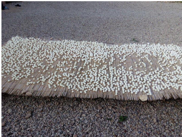
شکل ۴- خشک کردن کشک بر روی چق