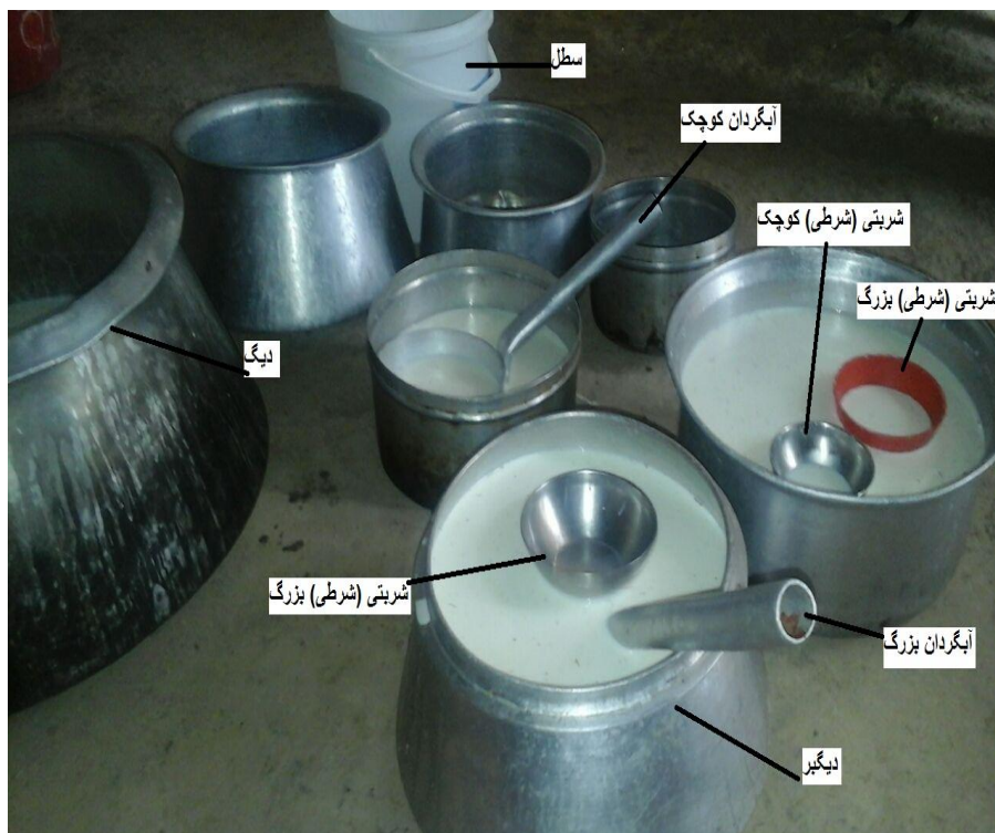
شکل ۳- ظروف پیمایش شیر در نظام دون

بزرگ است که معادل دو شربتی کوچک گنجایش دارد و کوچک‌ترین ظرف پیمایش، شربتی (شرطی) کوچک است (شکل شماره ۳).