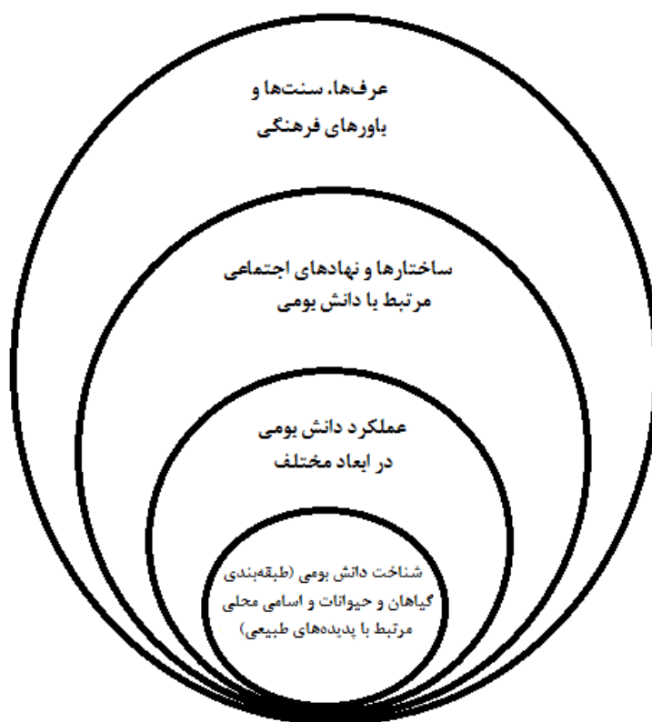
شکل ۲- سطوح تحلیل در تحلیل بدنه دانش بومی (Kalland, 1994)

شناخت دانش، عملکرد، ساختار اجتماعی، باورها و سنت‌هاست (شکل ۲)، که با شناخت دانش تجربی آغاز شده و در سطح دوم تأکید بر عملکرد دانش بومی دارد. در سومین سطح ساختار اجتماعی مرتبط با دانش بومی مورد توجه قرار می‌گیرد و در بالاترین سطح تحلیل، تمرکز بر شکل‌گیری یک درک منطقی و ادراک زیست‌محیطی است که می‌تواند باورهای بومی، عقاید و سنت‌های محلی را در برگیرد. باید توجه داشت که این چارچوب می‌تواند در تحلیل دانش بومی مؤثر واقع شود و بر اساس آن مؤلفه‌های مختلف دانش بومی قابل بررسی و تحلیل هستند.