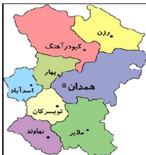
شکل ۲- نقشه استان همدان

استان همدان با مساحت ۱۹۴۹۳ کیلومتر مربع و جمعیت ۱۷۵۸۲۶۸، یکی از استان‌های غربی کشور است که از شمال با استان‌های زنجان و قزوین، از سمت جنوب به استان لرستان، از غرب به استان‌های کردستان و کرمانشاه و از سمت شرق با استان مرکزی همسایه است. این استان بین مدارهای ۳۳ درجه و ۵۹ دقیقه تا ۳۵ درجه و ۴۸ دقیقه عرض شمالی از خط استوا و ۴۷ درجه و ۳۴ دقیقه تا ۴۹ درجه و ۳۶ دقیقه طول شرقی نصف‌النهار گرینویچ واقع شده است و شامل ۹ شهرستان، ۲۵ بخش، ۲۷ شهر، ۷۳ دهستان و ۱۱۲۰ روستا است.