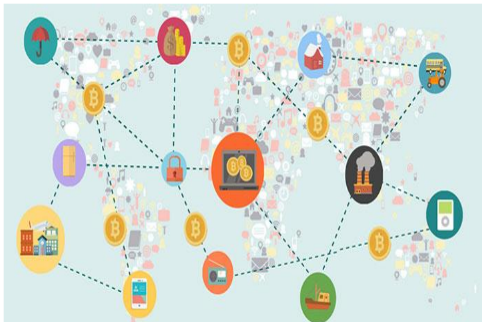
شکل (۱): نمودار شکلی شیوه مبادله به سبک بیت‌کوین را نشان می‌دهد.

که در روزنامه «واشنگتن پست» منتشر شد، نوشت: «رسانه‌های مرتبط با گروه تروریستی داعش پس از آن که سرزمین‌های تحت اختیارشان در سوریه و عراق را از دست دادند اغلب فعالیت‌های مالی خود را به دنیای مجازی منتقل کرده و بیش از گذشته از بیت کوین استفاده می‌کنند».