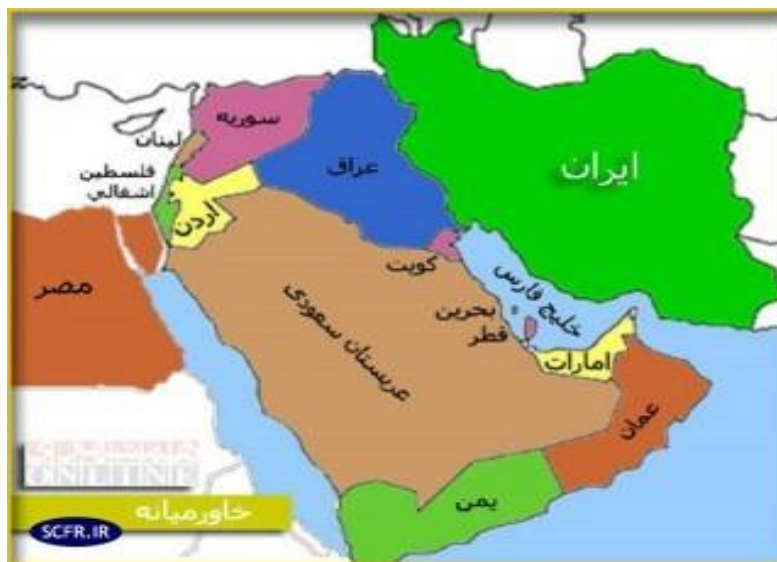
شکل شماره ۲: نقشه محدوده‌ی جغرافیایی خاورمیانه

آنچه که به عنوان ویژگی‌های خاورمیانه شرح داده شد؛ همان عوامل و عناصری هستند که سبب بروز بحران و یا به بیانی دیگر، سبب ظهور رنسانس ایدئولوژیک در این جغرافیا شده‌اند.