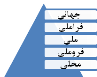
شکل شماره ۱: انواع سطوح (قالیباف، ۱۳۹۴)

مقیاس به عنوان دامنه جغرافیایی تأثیر عمل انسان یا گروه انسانی (فلینت، ۱۳۹۱: ۴۷). با توجه به اینکه گروه تروریستی داعش به عنوان یک عامل ژئوپلیتیکی برای انجام فعالیت‌های تروریستی خود از فضای مجازی، استفاده می‌کند؛ واضح است که سطح فعالیت این عامل ژئوپلیتیکی تنها محیط جغرافیایی نیست و این گروه تروریستی برای رسیدن به اهداف خود بخش مهمی از فعالیت‌هایش را در فضای مجازی انجام می‌دهد.