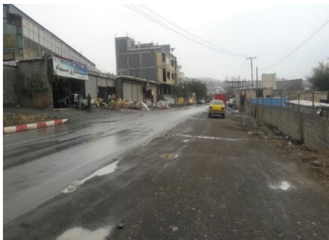
شکل ۳: ورودی نایسر؛ تراکم زباله‌های صنعتی