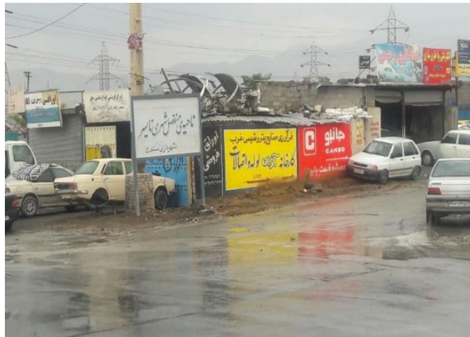
شکل ۲: ورودی نایسر؛ تراکم فعالیت‌های فنی و ریختن زباله‌ها در اطراف خیابان