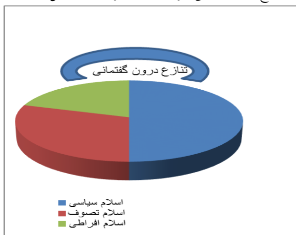
تنازع درون گفتمانی جریانات اسلامگرا در جهان اهل سنت