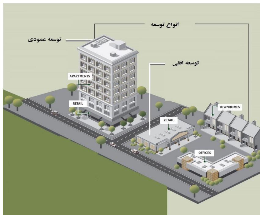
عکس ۱- توسعه ترکیبی اختلاط کاربری‌ها بصورت افقی و عمودی