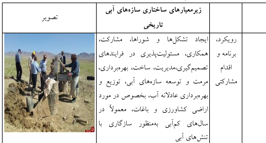
جدول ۳- تحلیل اصول حاکم بر ساختار، عملکرد و مدیریت سازه‌های آبی کهن در مقیاس کلان

ویژگی‌های حاکم بر سازه‌های آبی تاریخی در یک چارچوب فکری منسجم به‌گونه‌ای شکل گرفته‌اند که ضمن تأمین شریان حیاتی شهر و خلق سکونتگاه‌های انسانی، با حداقل تأثیرات منفی بر محیط طبیعی، بهترین کیفیت زندگی را با توجه به بستر محیطی و شرایط اکولوژیک برقرار نماید و تعادلی پویا و مانا بین محیط طبیعی و مصنوع شکل گیرد. با توجه به توضیحات مذکور تحلیل اصول عقلانیت اکولوژیک در ساختار، عملکرد و مدیریت سازه‌های آبی تاریخی، همراه با تصاویری از مصادیق در مقیاس کلان (جدول ۳)، مقیاس میانی (جدول ۴)، مقیاس خرد (جدول ۵) به تصویر کشیده شده است.