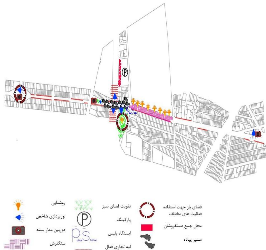
شکل ۳- اقدامات پیشنهادی در محدوده مطالعاتی در راستای تقویت زندگی شبانه

با توجه به مطالب یادشده اقدامات پیشنهادی در محدوده مطالعاتی در راستای تقویت زندگی شبانه بصورت نقشه فضایی و به‌طور خلاصه در شکل شماره ۳ نشان داده شده است.