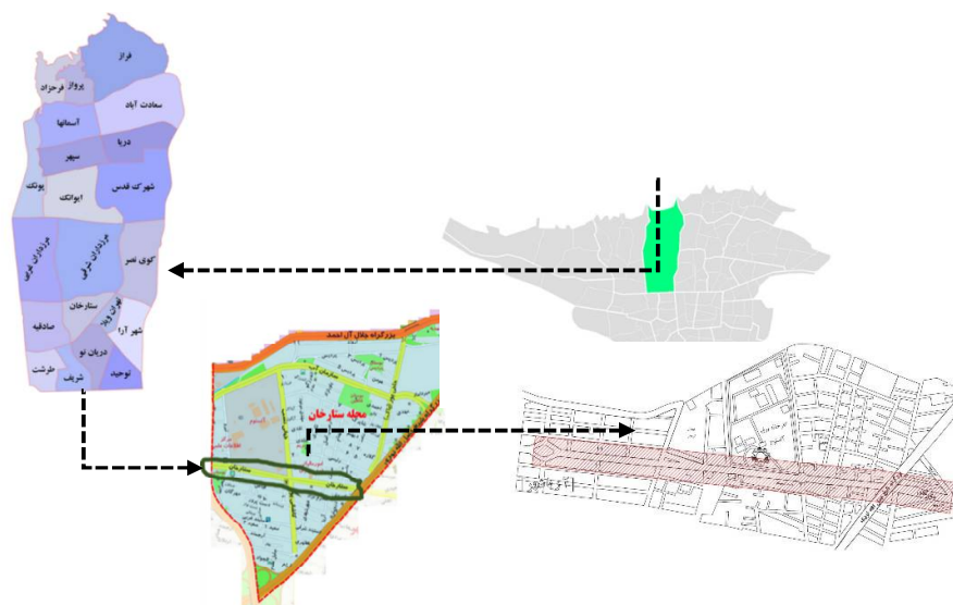
شکل ۲- معرفی حوزه مطالعاتی

ماتریس اصول و شاخصه‌ها: همان‌گونه که در چارچوب نظری پژوهش هم اشاره شد تحلیل‌ها نشان می‌دهند که ۱۳ اصل مهم مورد شناسایی در طراحی کالبد شهری (جدول شماره ۱) می‌توانند در شاخص‌های مختلف فضاهای شبانه شهری در چهار بُعد اقتصادی، اجتماعی، گردشگری و فرهنگی اثرگذار باشد. بر این اساس، با استفاده از اصول و همچنین عوامل چهارگانه و شاخصه‌های مؤثر بر فضای شهری ۲۴ ساعته، ماتریسی تهیه شده (جدول شماره ۵) که در آن، هرکدام از اصول یکی از حروف انگلیسی کوچک و هرکدام از شاخصه‌ها، یکی از حروف بزرگ انگلیسی را به خود اختصاص داده‌اند. با استفاده از روش دلفی، این ماتریس توسط ۱۰ کارشناس خبره حوزه تخصصی مورد تحلیل قرار گرفته است. هر کارشناس با مقایسه دوبه‌دوی هر اصل با هر شاخصه، به تناسب معنادار بودن و میزان تأثیرگذاری، اعداد ۱ تا ۵ را در ماتریس وارد نموده که میانگین نتایج آن در جدول شماره ۵ بیان شده است.