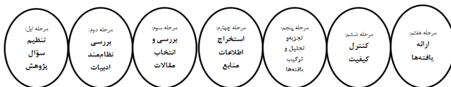
شکل ۱. مراحل فراترکیب سندلوفسکی و باروسو (۲۰۰۷)

موضوع مورد نظر را بررسی می کند. ب: طرح مرور جداگانه پژوهش است که در آن، پژوهشگر به بررسی عمیق هر یک از پژوهش ها به منظور فراهم ساختن خلاصه ای از هر پژوهش در رابطه با مضمون موردنظر پژوهشگراست (به نقل از گندمی حسارودی و سجادی، ۱۳۹۵). پژوهش حاضر از نوع طرح مرور تلفیقی است که برای پیاده سازی این طرح تحقیق در پژوهش حاضر از روش هفت مرحله‌ای فراترکیب سندلوفسکی و باروسو ۱ (۲۰۰۷) استفاده شد.