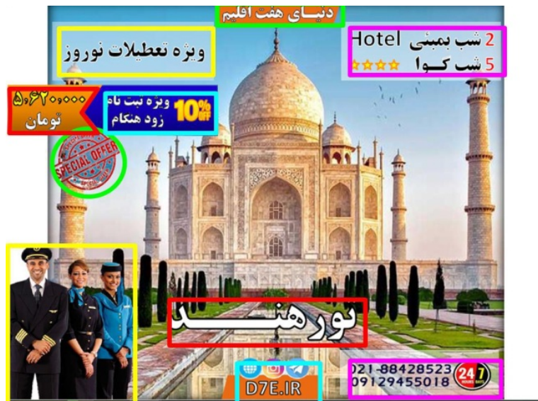
شکل (۳). ناحیه مورد توجه (AOI)

ابزار مورد استفاده در فرآیند اجرای آزمایش به منظور ثبت واکنش بصری و بررسی میزان توجه افراد به تبلیغات مورد آزمایش دستگاه ردیابی چشم از نوع ثابت ۲ است. به کمک این دستگاه، داده‌های مربوط به مشارکت کنندگان ضبط شد و به کمک نرم‌افزار Tobii studio خروجی‌های دستگاه به صورت نقشه‌های حرارتی ۳ ، نقشه‌های نقاط خیره شدن افراد ۴ و cluster به منظور تجزیه و تحلیل و به تصویر کشیدن نحوه و الگوی مشاهده افراد در اختیار پژوهشگر قرار گرفت. در نهایت، به منظور بررسی شاخص‌ها و فرضیه‌های پژوهش نیز داده‌ها در نرم‌افزار SPSS مورد تجزیه و تحلیل قرار گرفت.