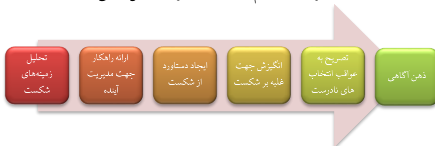
جدول ۱: کدگذاری باز و محوری داده‌های قرآنی در موضوع شفقت بر خود

نمودار ۲: مفاهیم بسط یافته در مؤلفه‌ی ذهن آگاهی