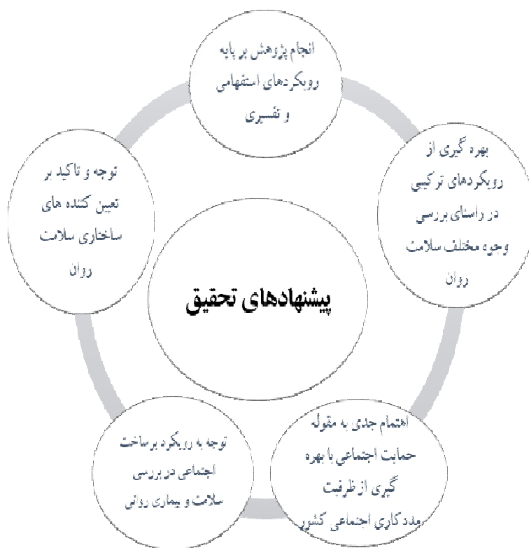
شکل ۴- پیشنهادهای تحقیق