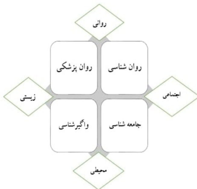
شکل ۱- رشته‌های اصلی مطالعات سلامت و بیماری روان (Switzer & et al, 2008: 68)

رویکردهای روان‌شناسی و روان‌پزشکی فردگرایانه هستند و علل و درمان اختلالات روانی را در فرد مبتلا به اختلال جستجو می‌کنند. این نظریه‌ها مجزا بودن جسم و ذهن را می‌پذیرند و استدلال می‌کنند ذهن طی مراحل رشد و توسعه می‌یابد و اختلال ذهنی بر اساس اختلالات در رشد مشخص می‌شود که از رویدادهای تکان‌دهنده دوران کودکی یا از سایر اختلالات در طی مراحل رشد نشات می‌گیرند (تاسیگ و همکاران، ۱۳۸۶: ۳۴۹). رویکردهای روان‌شناسی و روان‌پزشکی، فردگرایانه و در جستجوی علل بروز اختلالات روانی و درمان آن‌ها در جسم و روان فرد هستند، درحالی‌که جامعه‌شناسی و واگیرشناسی هنگام مطالعه مباحث سلامت روان بر ویژگی‌های بیرونی افراد یعنی محیط‌های اجتماعی و طبیعی متمرکز هستند.