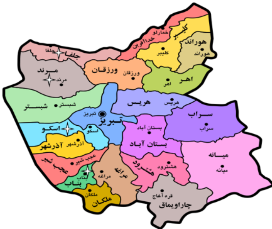
شکل ۱. موقعیت جغرافیایی روستاهای مورد مطالعه در استان آذربایجان شرقی

* تعداد جمعیت و خانوار بر اساس نتایج سرشماری عمومی سال ۱۳۹۵ ذکر شده است.