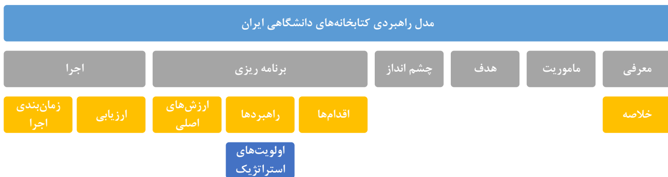
شکل ۱. مدل راهبردی کتابخانه‌های دانشگاهی ایران