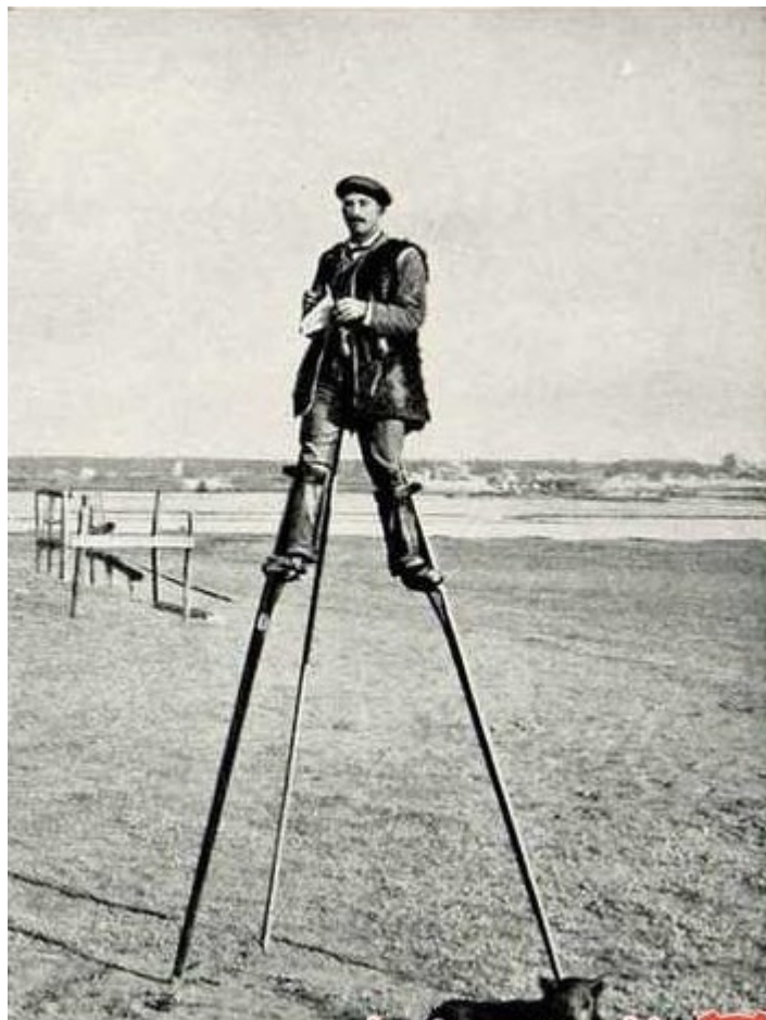
عکس شماره ۱- چوپا

چوپان با استفاده از این وسیله در ارتفاع ۳ یا ۵ متری قرار می‌گیرد و می‌تواند فضای بیشتری را تحت کنترل داشته باشد و سریع‌تر نیز راه برود. با به کارگیری این وسیله ساده دو چوپان که در شرایط معمول قادر به کنترل بیش از ۶۰۰ رأس دام نیستند توانایی کنترل ۲ برابر این تعداد دام را خواهند داشت بدون آن‌که آنها را جمع کنند و یا طوری رها کنند که از کنترل خارج شوند. در حال حاضر هر ساله در سویس مسابقاتی با شرکت مردان و