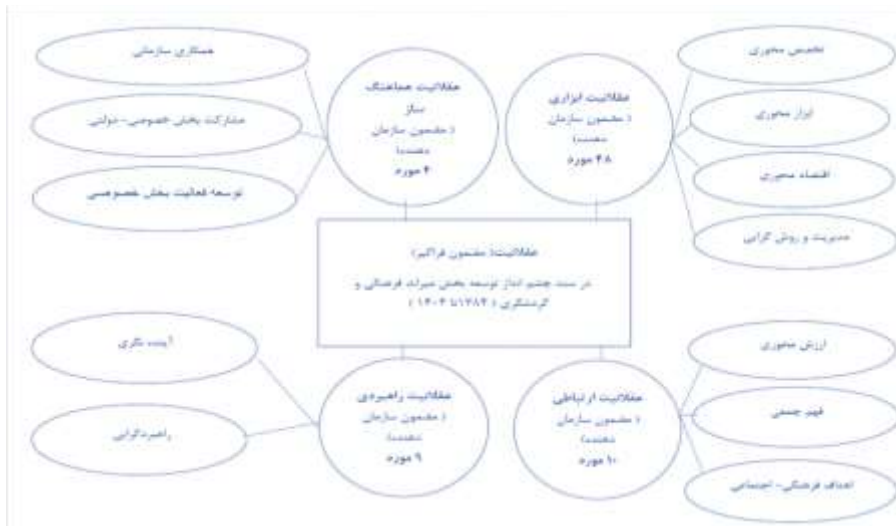
شکل ۲. شبکه مضامین عقلانیت در سند چشم‌انداز توسعه میراث فرهنگی و گردشگری