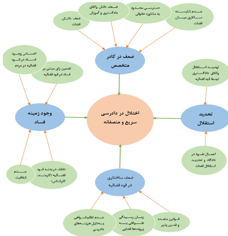
شکل یک - دیاگرام شکل‌گیری مقوله‌های اصلی در تحلیل مضمون