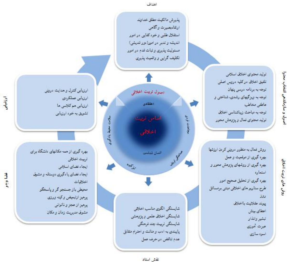
شکل شماره ۲: ویژگی عناصر الگوی پیشنهادی تربیت اخلاقی در آموزش عالی

همان‌طور که مشاهده می‌شود، دستیابی به تربیت اخلاقی مبتنی بر قرآن کریم و بر اساس تفسیر المیزان جهت دهنده و راهنمای برنامه است. بین عناصر برنامه درسی تربیت اخلاقی انسجام و همخوانی وجود دارد با پیکان‌های جهت‌دار نشان داده‌شده و یکپارچگی و انعطاف الگو به صورت دایره‌وار است. رنگ زمینه از پررنگ به کم‌رنگ تغییر کرده است و این نشان‌دهنده اهمیت و اولویت مبانی و سپس اصول تربیت اخلاقی است. از طرفی