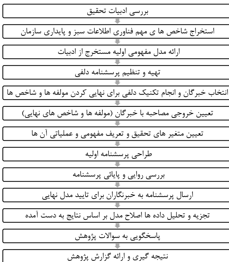
شکل ۳: مراحل عملی پژوهش

موضوع تحقیق حاضر توجه به مفاهیمی را مدنظر قرار داده که چارچوب اولیه آن از جمله مدل های اولیه تحقیق توسط محقق تبیین گردیده است، لیکن برای رسیدن به چارچوب نهایی آن مواردی نظیر تبیین فرضیه و یا عدم نیاز به ارائه آن و احیاناً پرداختن به مفاهیم و متغیرهای جدید و مؤثر در مدل های مذکور، بهره گیری از نظرات خبرگان به روش دلفی را برای اعتبار بخشیدن به این بخش از کار تحقیق ضروری می نماید. این بخش از مطالعه ماهیت توصیفی و کیفی دارد که در دو مرحله انجام شده است الف: در مرحله اول به شکل اسنادی و کتابخانه ای به گردآوری ابعاد و شاخص های موجود فناوری اطلاعات سبز و پایداری