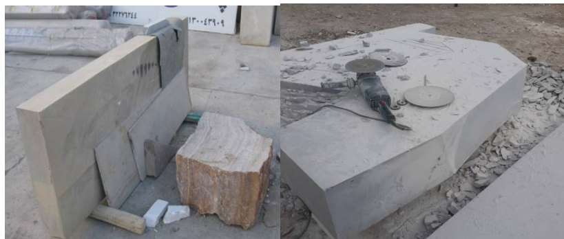
عکس‌های ۱۳ و ۱۴- کارگاه‌های شهرکرد و هفشجان،.