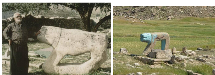
عکس ۳۱- سردشت دزفول، ۱۳۹۱