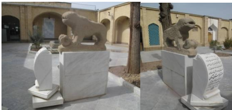
عکس ۲۷ و ۲۸- موزه شهرکرد، عکاس: نویسنده، ۱۳۹۳

علاوه بر تمگن و دارایی مشتریان، به نظر می‌رسد که اوضاع کشوری و شرایط منطقه در دوره‌های مختلف در نوع و اندازه یا نگاره‌های روی شیرسنگی، مؤثر بوده است. بررسی و پژوهش میدانی نگارنده، نشان می‌دهد که در دوره‌هایی که اقتدار، عظمت و روح دشمن‌ستیزی بر ایران حاکم بود، شیرهای سنگی نیز بزرگ‌تر و با هیبت‌تر بودند. شیرهای دوره‌های زندیه، افشاریه و صفویه از تندیس‌های دوره‌های قاجار و پهلوی با هیبت‌ترند. هم‌اکنون نیز تندیس‌های شیرسنگی از نظرگاه پیکرتراشی و حجم و اندازه، درشت‌تر و باصلابت‌ترند (مشاهده میدانی نویسنده). در ورودی موزه باستان‌شناسی شهرکرد، شیرسنگی وجود دارد که از منطقه برجویی (شهرستان لردگان) به این مکان منتقل شده است. بلندترین نقطه آن از زمین سرشیر است که حدود ۸۰ سانتی‌متر و بلندی شیر از دم تا دهان آن یک متر است. این شیر از لحاظ گونه (تیپ) خاصی از نمونه‌های موجود است که کله قوچی در زیر پای اوست. این تندیس، یادآور برتری بختیاری‌ها بر همسایگان قشقایی در نبردهای یک‌صد سال اخیر است.