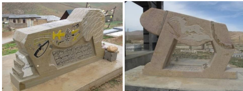
عکس ۱۱- لالی خوزستان و عکس ۱۲- کوهرنگ، ، ۱۳۹۰-۱۳۹۱

کارکرد سنگ، طرح و نقش‌های آن در بختیاری بسیار متنوع است. اگر به شیرسنگی هم به‌عنوان سنگ قبر، نگاه کنیم، نوشته‌ها و نقش‌های مختلفی روی شیر نوشته یا حک می‌کنند. روی شیر سنگی (کمر یا سنگ زیرین آن) نام فرد، تاریخ تولد و فوت، نام پدر، ایل و طایفه او را می‌نویسند. عبارت‌ها و نوشته‌هایی چون: لافتی الاعلی لا سیف الا ذوالفقار، عدد، متن فارسی، عربی، میخی و اوستایی، شعر، روی این تندیس حک می‌شود (نک: عکس‌های ۱۱ و ۱۲).