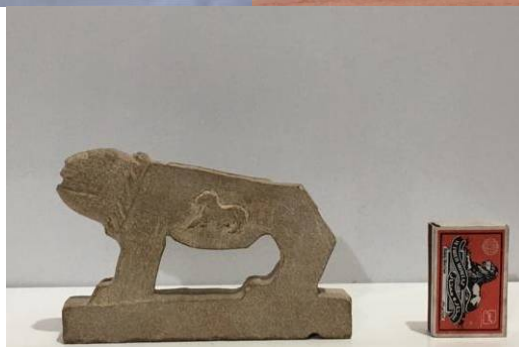
عکس‌های ۲۲، ۲۳ و ۲۴- عکاس: نویسنده، ۱۳۹۸

شیرسنگی در قالب‌های هنری، نقاشی، نماهای شهری، اصول معماری و طراحی داخلی و نماهای ساختمان، کاشی‌کاری داخلی، در و پنجره هم راه‌یافته و سبب نوعی کارکرد جدید شده است. در کارگاه‌های ساخت شیرسنگی، به سفارش مشتری، ریتون،