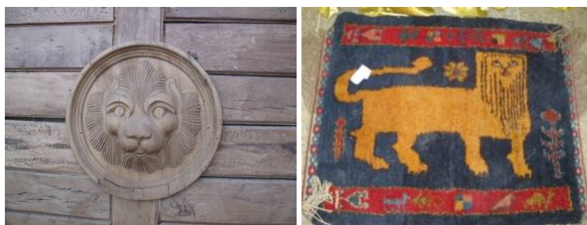
عکس ۱ - نقش شیر روی خرسک و گبه عکس ۲ - پیکر یا سرشیر روی در ساختمان‌ها، ۱۳۹۰.

در فرهنگ، هنر و ادبیات ایرانی، جانوران و به‌ویژه، شیر، پلنگ، یوز، خرس، گرگ و... جایگاه مهمی دارند. در این میان، نزد مردم ایران، همیشه «شیر» به‌عنوان حیوانی شجاع، قدرتمند، مغرور و پرابهت شناخته می‌شود. در دانش نجوم (یاحقی، ۱۳۹۱: ۵۳۳)، فرهنگ‌نامه، علوم انسانی و طبیعی، باهوش، باصلابت، حمله‌بر، غُران، دونده، باشکوه و زیباست. شیر در فرهنگ اقوام ایرانی نماد بزرگی، اقتدار، دل‌آوری و گردن افرازی است. علاوه بر نقش میانی بیرق و پرچم ملی در دوره‌های متمادی، در علم افلاک و بین صورت‌های فلکی هم برای شیر (اسد) جایگاه رفیعی در نظر می‌گیرند تا هم در زمین و هم در آسمان، این بلندی و رفعت نمایان‌تر باشد. هرکدام از طبقات و گروه‌های اجتماعی عام یا خاص، مانند: صنعتگران، سُرایندگان، هنروران، داستان‌نویسان، قصه‌گویان، افسانه‌پردازان، منظومه سُرایان، نظامیان، در آثار خویش، به این حیوان توجه دارند. وجود نقش، پیکره و یا سردیس شیر در بناهای تاریخی، بوستان‌ها، تندیس‌های شهری، بافت قالی (نک. قاضیانی، ۱۳۷۶ و عباسی فرد، ۱۳۸۸) و دیگر بافته‌های روستایی و عشایری، معماری، صنعت دستی، کالاهای فرهنگی، چاپ اسکناس، سکه و سنگ قبر جایگاه مهم نمادین و رمزی این عنصر فرهنگی-اجتماعی و سیاسی-تاریخی را بین مردم جهان، به‌ویژه ایرانیان و به‌طور خاص «بختیاری‌ها» نشان می‌دهد.