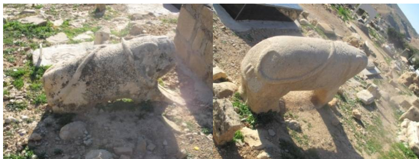
عکس ۳ و ۴- خوزستان، اندیکا، ۱۳۸۹

۱- دسته قدیمی‌تر: این شیرها از دوره صفوی تا قاجار ساخته شده‌اند. این سنگ‌ها ویژگی‌های زیر را دارند: اندام درشت، قامت کوتاه، تنه گرد و منحنی، تنومند و باهویت ترسناک و مقتدر (عکس ۳ و ۴ در خوزستان).