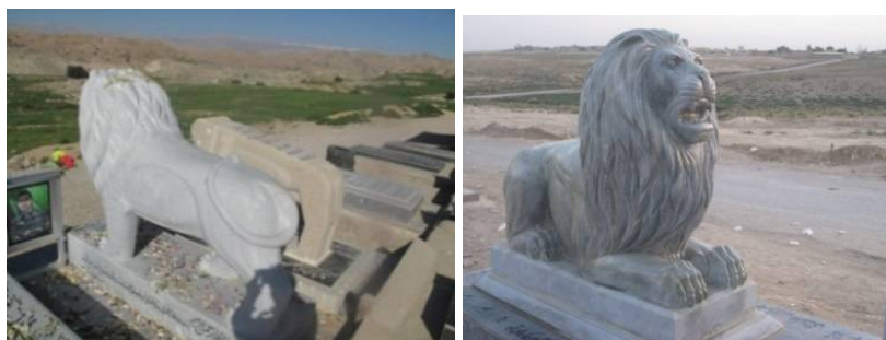
عکس ۸- خوزستان، لالی، عکاس: نویسنده، ۱۳۹۱

۳- دسته نو (امروزی): تحوّل و دگرخواهی شیرهای امروزی، ویژگی این گروه است. بیش‌تر با سنگ‌های کریستال، مرمر و روشن (سفید، زرد، قهوه‌ای یا آبی)، شیرهایی به هیبت شیر جنگل (رنال و نه نمادین!!) می‌سازند، با جزییات و ظرافت‌های خاص که آن را به نمونه واقعی حیوان نزدیک‌تر می‌کند (عکس ۷). روی پیکره این شیرها نقش و نگاره نیست. ولی در پای آن‌ها عکس مرد درگذشته و اشعاری در وصف او به چشم می‌خورد (عکس ۸). بختیاری‌ها معتقدند که شیرهای واقعی همان تندیس‌های قدیمی‌اند و این شیرها شکل جانوری دارند، نه انسانی.