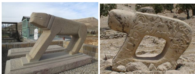
عکس ۳۳- شهرستان خانمیرزا، آلونی، عکاس: نویسنده، ۱۳۸۹

همان‌گونه که گفته شد شیران سنگی، تندیس توپُر، حجمی، تراش‌خورده و نگارین هستند و بین ۱۰۰۰ تا ۳۰۰۰ کیلوگرم وزن دارند. این تندیس انتزاعی و نمادین تنومند، ابهت و شکوه مردان و شیرهای ایرانی را می‌رساند که دیدنشان حتی در زنجیر و قفس، لرزه بر اندام بینندگان می‌افکند. از نظرگاه ریخت (قیافه، ژست و فیگور)، قامت، گردی، انحنا و وزن و حجم شیرهای سنگی تنوع خاصی دارند. برخی نمونه‌های کهن، گرد و کوتاه‌اند؛ برخی نیز تخت و زاویه دارند که به سلیقه استادکاران و سبک محلی آن‌ها مربوط می‌شود. شیرهای قدیمی بیشتر هیبت و شکوه خاصی دارند که کوتاهی، گردی، ارتفاع کم از زمین صاف بودن پشت و خمیدگی سُرین (کپل) از این ویژگی‌هاست. برخی دست‌وپاهایشان به هم پیوسته و گروهی نیز فاصله شکم تا زمین کاملاً خالی است. نگارین و منقش بودن، حلقه گردن، نمایان بودن بیضه‌ها، قرار گرفتن دم در سمت راست، شمشیر مولا علی، داشتن اشعار حماسی از ویژگی‌های اصلی بردشیرهای بختیاری است (نک. عکس ۳۳). قبلاً ابزار و لوازم کار سنگ‌تراشان ساده و بیشتر قلم و چکش بود ولی امروز دستگاه‌های برقی و کوهپُره‌های پیشرفته کار را برای تراش دادن سنگ، راحت‌تر کرده است. استادکاران، به سلیقه خود و یا برای جلب نظر متنوع مشتریان، تغییراتی در شکل، اندازه و حالت‌های نگارین شیرها ایجاد می‌کنند (نک. عکس ۳۴).