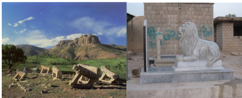
عکس ۳۹- گنجینه میراث فرهنگی چهارمحال و بختیاری

در شیرهای سنگی مطالعه شده برخی رو به غروب خورشیدند که شاید از ریشه‌های میترایی بازمانده باشند. برخی نیز چون سنگ قبر در امتداد پیکر مرده قرار دارند، به گونه‌ای که سرشیر موازی سر مرده است و در کل پهلوی آن روبه‌قبله است (نک. عکس ۳۹). در برخی نمونه‌های تازه، حالت شیرها، نشسته، به پهلو خوابیده، حمله بر و غرآن، نیز طراحی و ساخته شده‌اند؛ اگرچه این نمونه‌ها باحالت شیرسنگی انتزاعی در بختیاری، منافات دارند ولی سلیقه و علاقه‌مندی امروزی استادکاران و گاه تنوع‌طلبی مشتریان به این گونه‌ها بیشتر شده است (نک. عکس ۴۰).