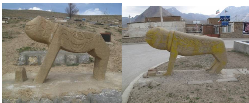
عکس ۲۰- چلیچه در شهرستان فارس،