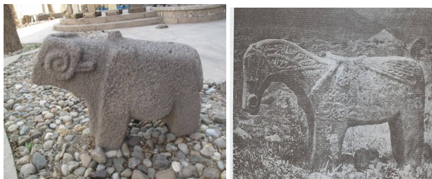
عکس ۴۱ و ۴۲- موزه تبریز، عکاس: نویسنده، ۱۳۹۲

۱۶- شباهت فراوان بین کاربُرد و استفاده از تندیس و نگاره‌های شیر، اسب سنگی (نک). عکس (۴۱) و قوچ (نک. عکس ۴۲) در فرهنگ بختیاری‌ها، آذری‌ها، قشقایی‌ها و حتی برخی کشورهای قلمرو ایران فرهنگی مانند آذربایجان، ترکیه و ارمنستان، برای پژوهشگران، ساده و اتفاقی نیست و به کارکرد و بهره‌مندی اقوام ایرانی در طول تاریخ اشاره دارد.