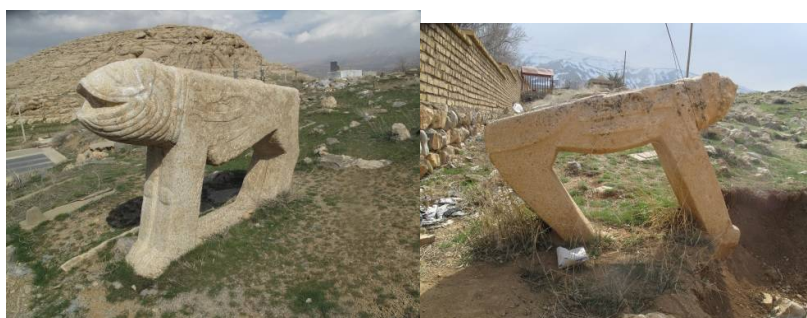
عکس ۲۹- روستای سنگچی، آورگان، عکاس: نویسنده، ۱۳۹۳

و بلندی آن به ترتیب ۱۳۰-۱۷۵-۳۵ سانتی متر است. در آورگان پشت امامزاده دو شیر تنومند هست که از بزرگترین نمونه‌های امروزی و کهن این تندیس‌اند که اندازه‌های آن‌ها ۱۹۰-۱۲۰ و ۳۵ سانتی متر است (نک. عکس ۲۹ و ۳۰). در خوزستان، سردشت دزفول یکی از تنومندترین شیرهای سنگی با ارتفاع ۱/۵ متر (نک. عکس ۳۱) و در امامزاده بابااحمد خوزستان (اندیکا)، شیرهای سنگی تنومند با ارتفاع ۱/۵ متر و قریب ۲ تن وزن وجود دارد (نک. عکس ۳۲).