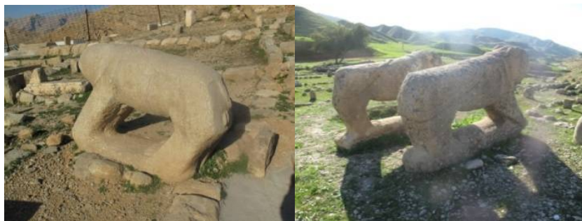
عکس ۶- بازفت، ۱۳۹۱