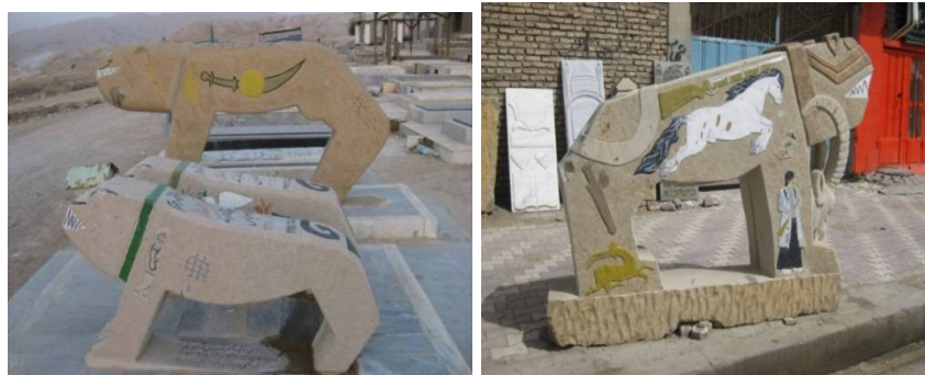
عکس ۹- شهرکرد، قبل از حمل، محل نصب کوهرنگ، عکاس: نویسنده، ۱۳۹۰

دوپیگر، شیر، کله قوچ، چوقای بختیاری، جقه بته، پنجه فلزی، و ... نمونه کاربرد و حکاکی این نگاره‌ها بردشیرهایی در کوهرنگ و لالی است (عکس شماره ۹-۱۰):