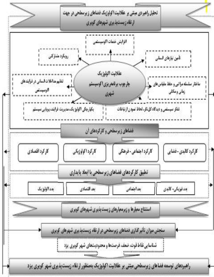
شکل ۱- چارچوب نظری تحقیق