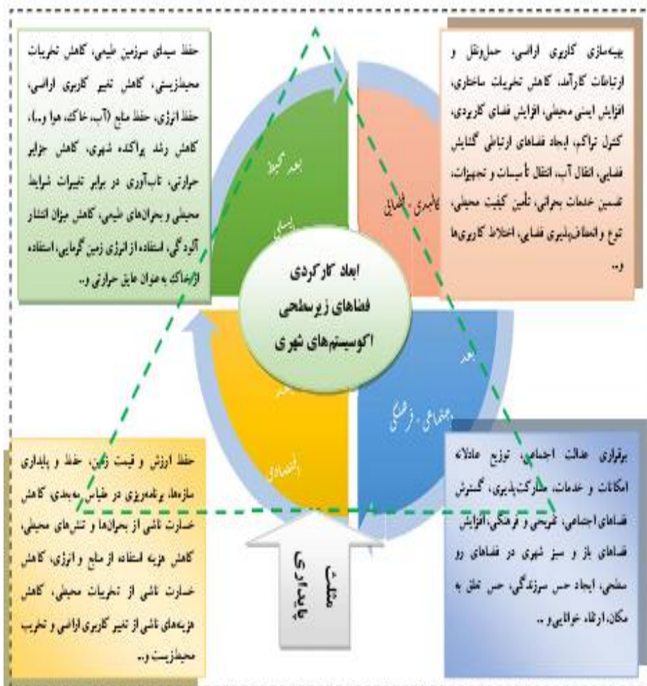
شکل ۲- تطبیق ابعاد کارکردی فضاهای زیرسطحی در اکوسیستم شهری و ابعاد توسعه پایدار