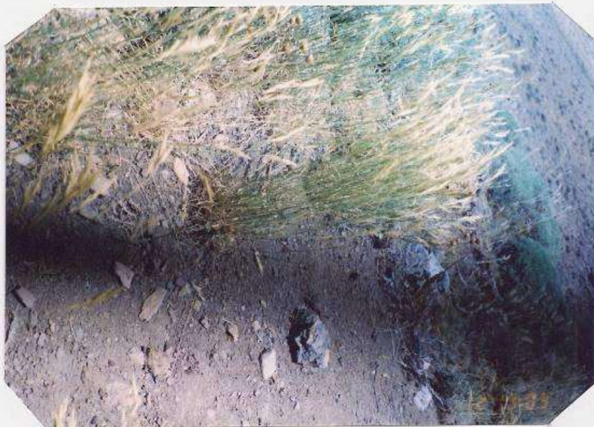
عکس شماره ۲۱