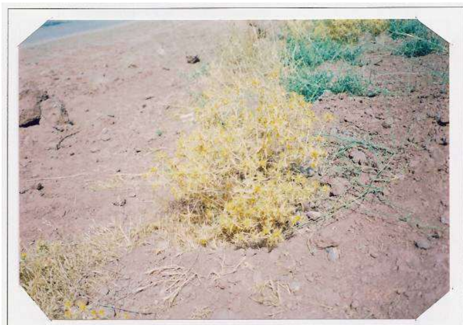
عکس شماره ۵