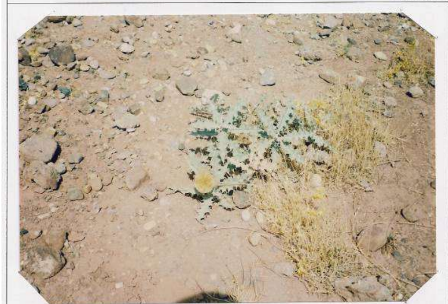
عکس شماره ۶