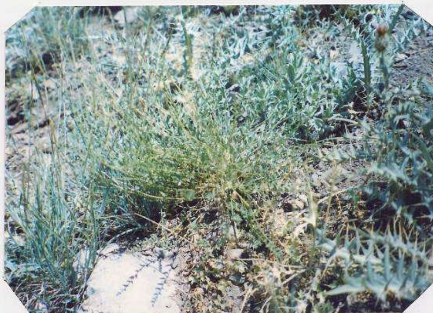
عکس شماره ۲۴