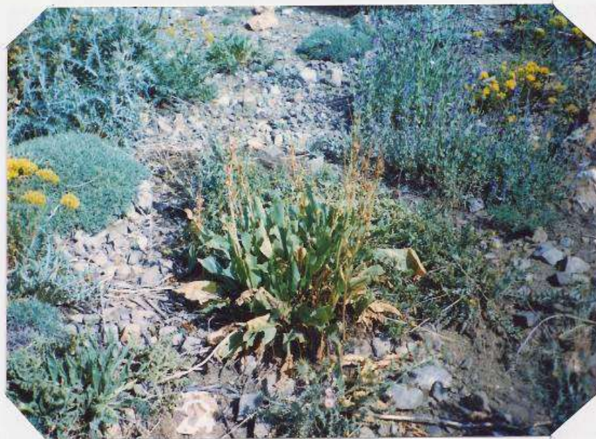
عکس شماره ۳۱

گوشه‌ای از گیاه‌شناسی دامداران روستای ... ۲۴۱