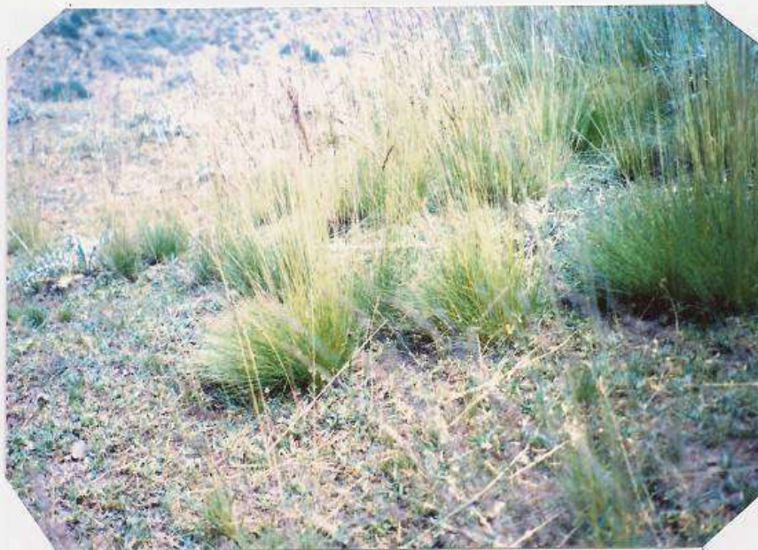
عکس شماره ۲۳

گوشه‌ای از گیاه‌شناسی دامداران روستای ... ۲۳۷