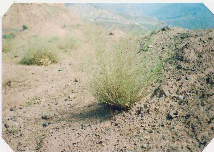
عکس شماره ۱۵

گوشه‌ای از گیاه‌شناسی دامداران روستای ... ۲۳۳