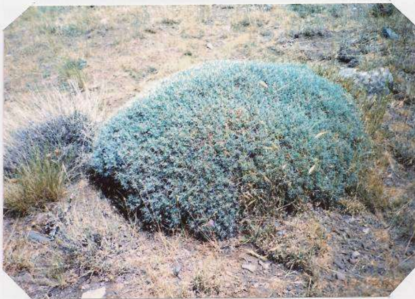
عکس شماره ۲۲