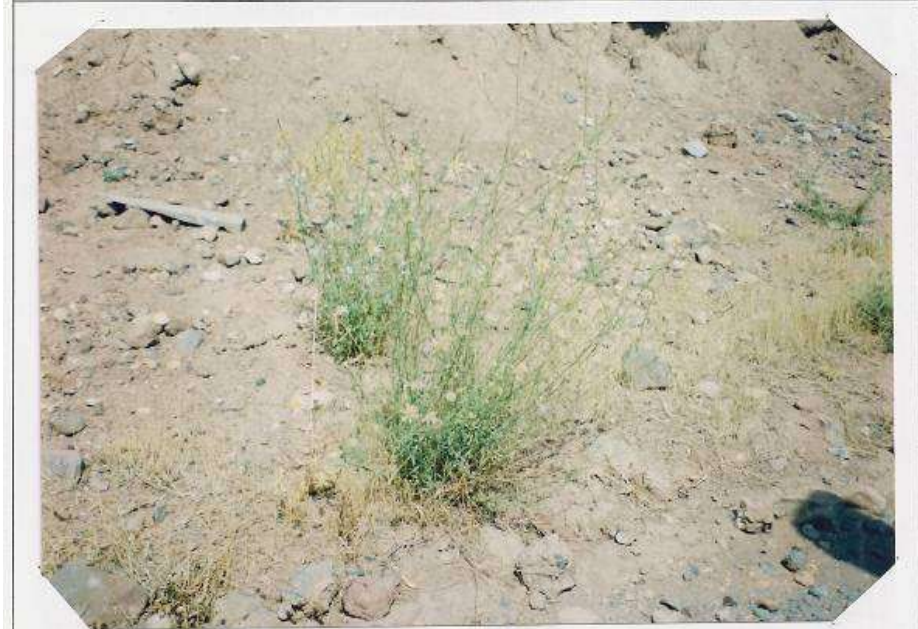
عکس شماره ۱۸