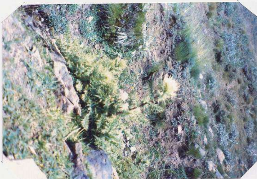
عکس شماره ۲