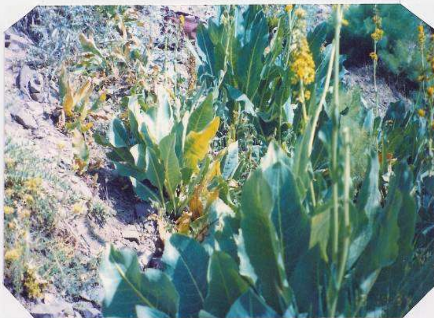
عکس شماره ۳۲