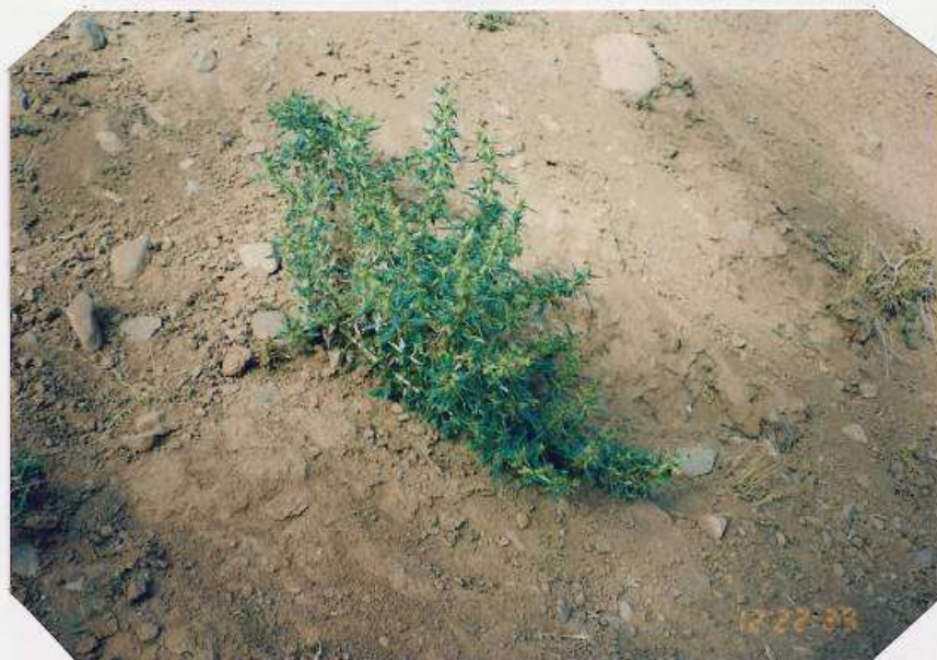
عکس شماره ۷

گوشه‌ای از گیاه‌شناسی دامداران روستای ... ۲۲۹