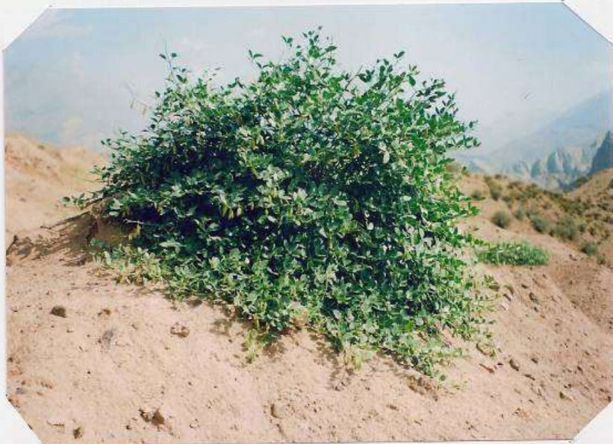
عکس شماره ۱۴