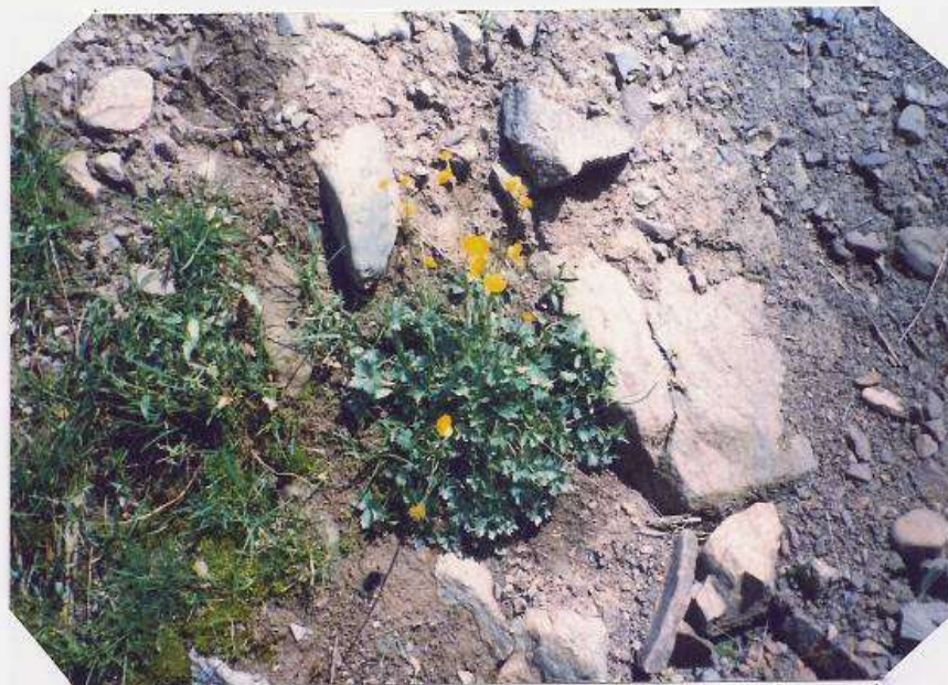
عکس شماره ۲۷