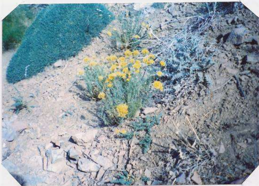
عکس شماره ۳۰