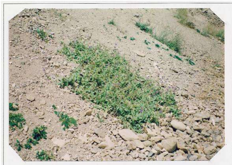
عکس شماره ۱۷