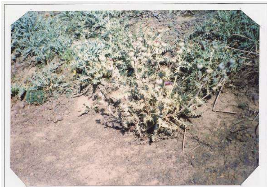
عکس شماره ۳

گوشه‌ای از گیاه‌شناسی دامداران روستای ... ۲۲۷