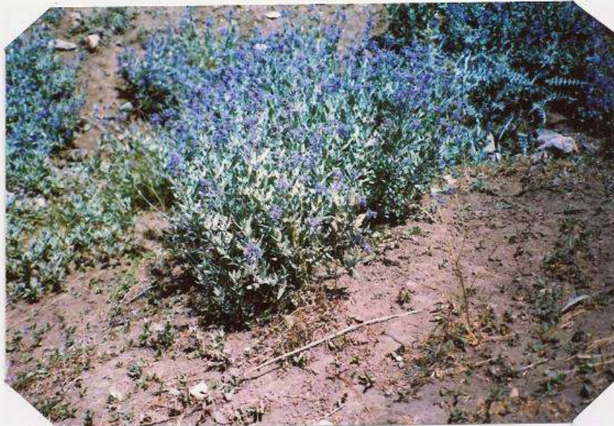
عکس شماره ۱