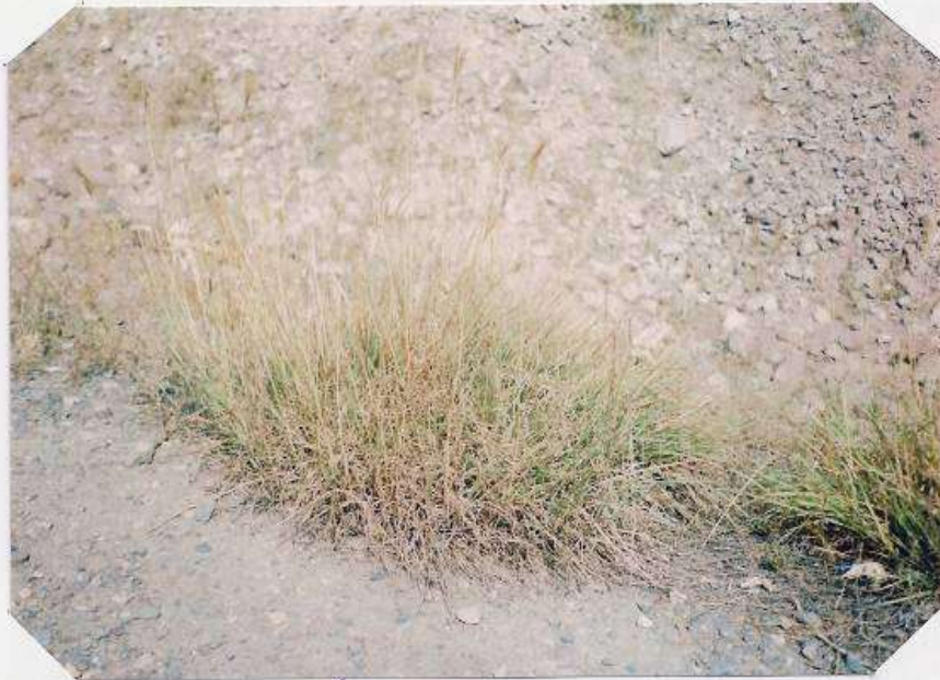
عکس شماره ۱۳