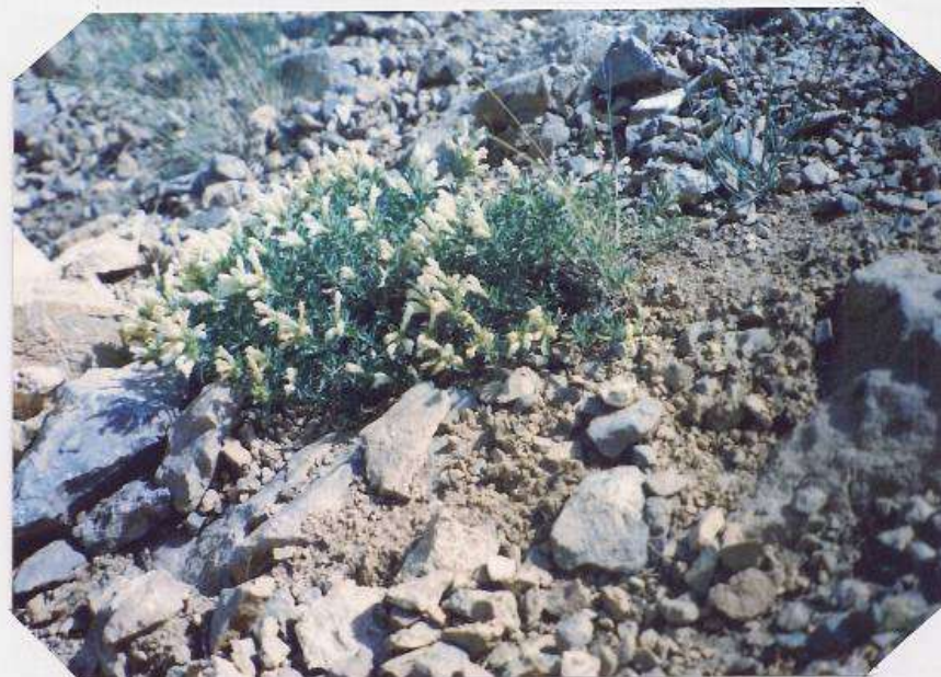
عکس شماره ۲۸