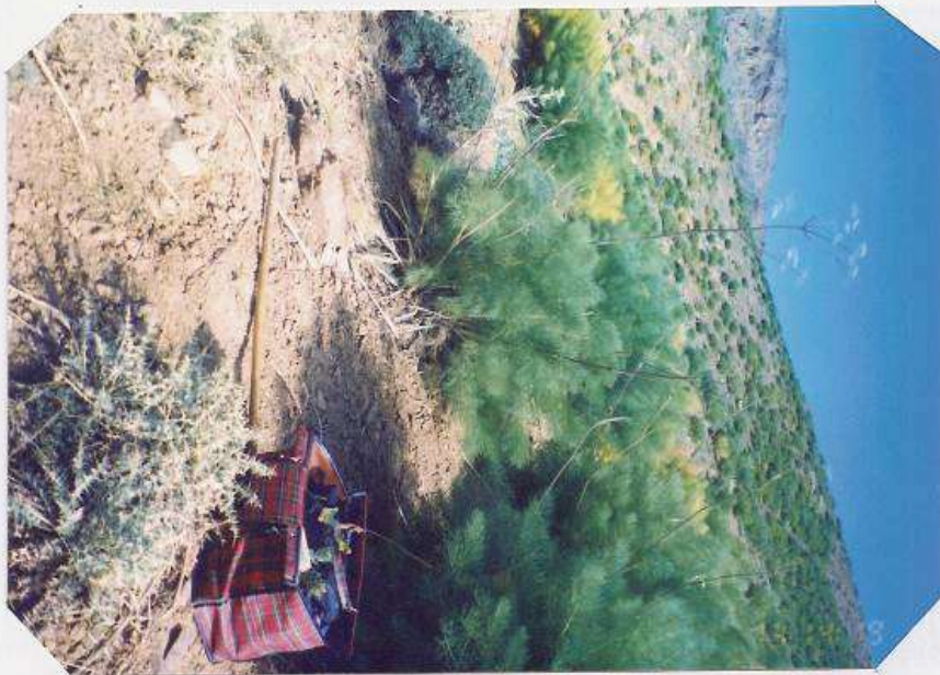
عکس شماره ۲۹