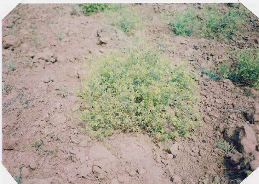
عکس شماره ۱۰