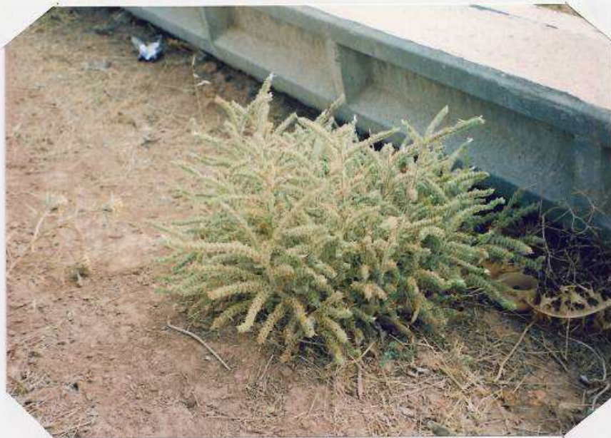
عکس شماره ۹