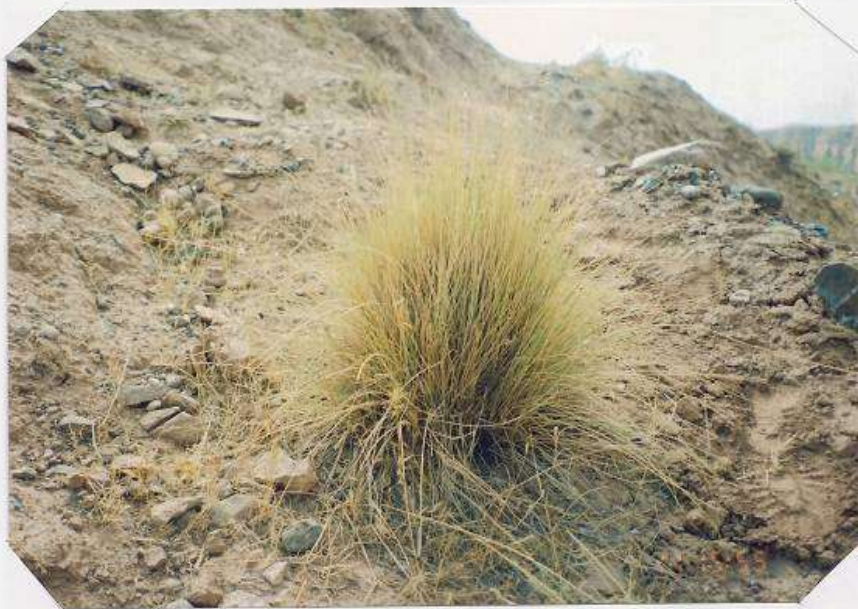
عکس شماره ۱۶