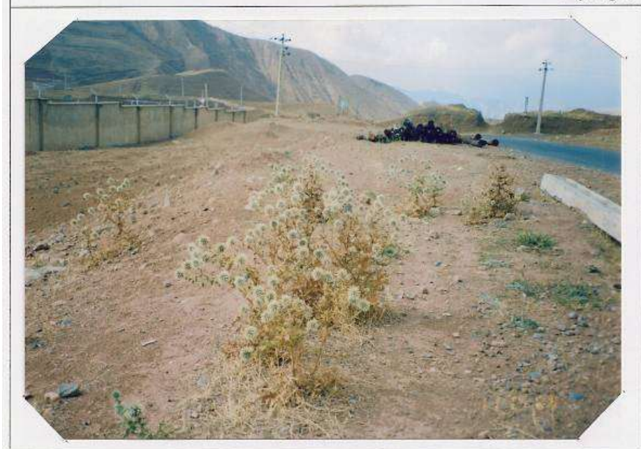
عکس شماره ۴