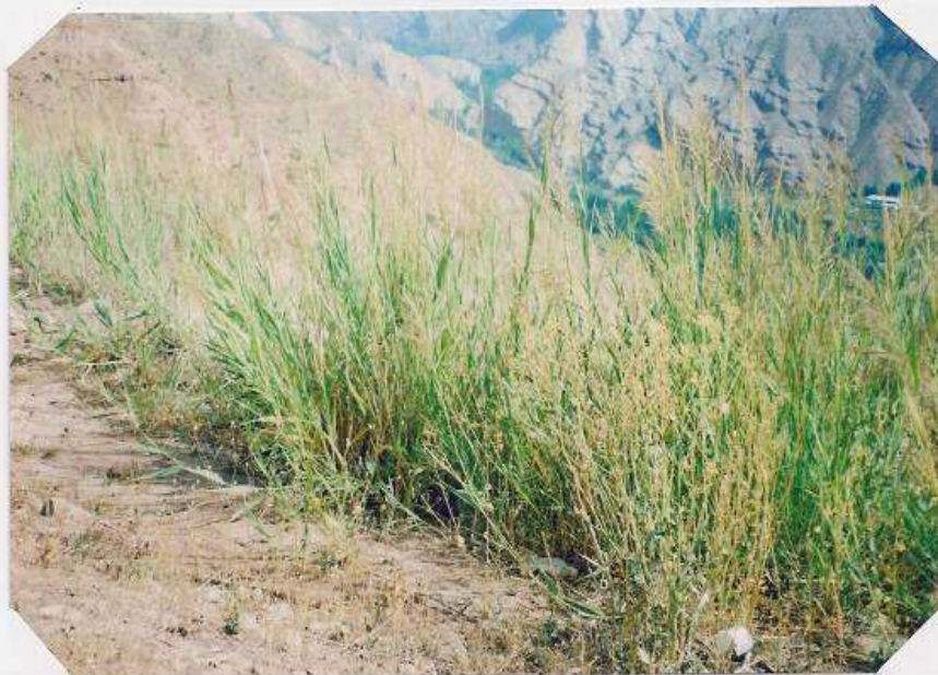
عکس شماره ۲۰