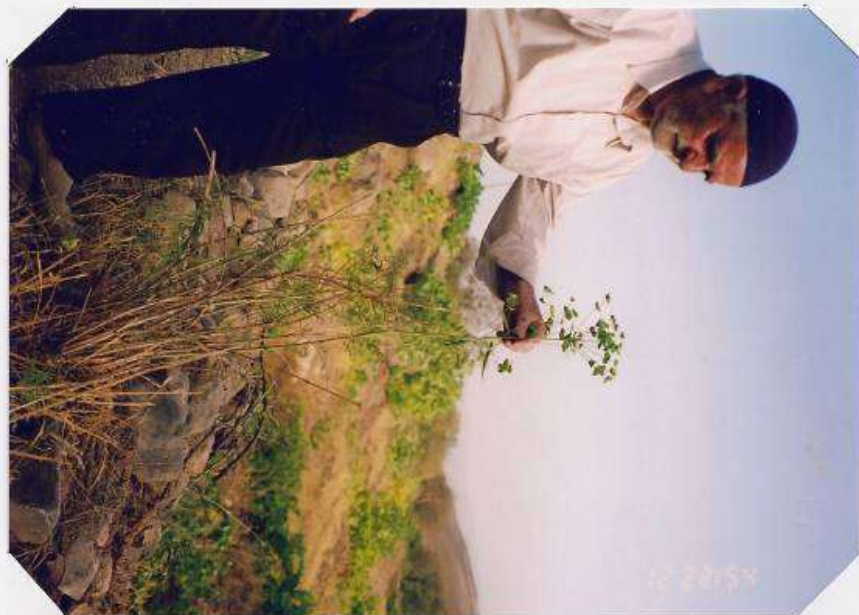
عکس شماره ۱۹

گوشه‌ای از گیاه‌شناسی دامداران روستای ... ۲۳۵