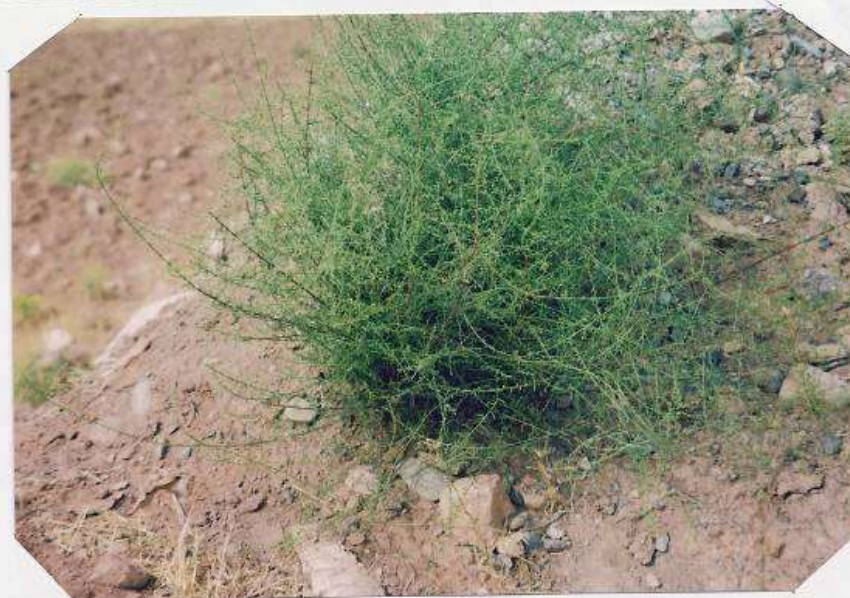
عکس شماره ۱۱

گوشه‌ای از گیاه‌شناسی دامداران روستای ... ۲۳۱