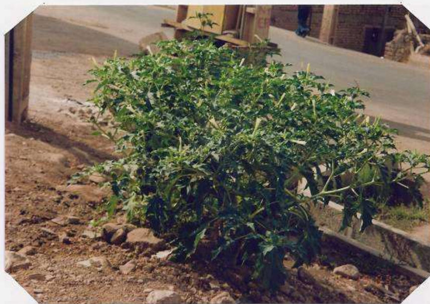
عکس شماره ۸