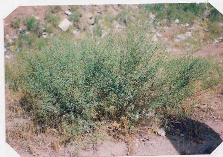
عکس شماره ۱۲