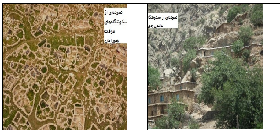
عکس ۷- سکونتگاه‌های موقت عکس هوایی (مردوخ، ۱۳۹۶: ۱۴۰). و دائم در منطقه هورامان (نگارندگان).

اسکان پیدا کنند آب چشمه‌ها بوده است ولی اگر بصورت گروهی و طایفه‌ای کوچ کرده باشند علاوه بر چشمه‌ها، آب‌های سطحی منطقه را با استفاده از روش‌ها و دانش‌های بومی؛ از جمله احداث کانال‌های آبی، قنات، آب‌بندها و غیره مدیریت کرده و در امر باغبانی مورد استفاده قرار می‌دهند. گاهی در میان آن‌ها خانواده‌های هستند که به صورت محدود دامداری می‌کنند ۲- هه‌وارنشینان (سکونتگاه‌های) موقت دام‌پرور: گروهی از ساکنان منطقه هورامان که معیشت مبتنی بر دام‌پروری داشته‌اند، زندگی آن‌ها بصورت کوچ به ارتفاعات بلند منطقه بوده است. به گونه‌ای که با شروع رویش گیاهان، فصل کوچ آن‌ها هم شروع می‌شود و تا اواخر تابستان ادامه دارد. در منطقه هورامان هر یک از گروه‌های دام‌پرور در ارتفاعات برای اسکان خود مکانی مشخص به نام «هه‌وار» دارند. با توجه به اینکه برف تنها منبع آبی اساسی و در دسترس مردم در ارتفاعات بالا است. این چاله برف‌های که توسط خود مردم منطقه در بازه زمانی خاصی شکل گرفته است نقش بی‌بدیلی در ایجاد سکونتگاه‌های موقت این منطقه دارد. بنابراین، بدون ایجاد مهم‌ترین منبع آب کوهستان یعنی چاله برف‌ها و مدیریت حفظ و نگهداری آن‌ها در منطقه هورامان، جوامع دام‌پرور و کوچ‌رو در ارتفاعات منطقه شکل نمی‌گرفت (عکس ۸).