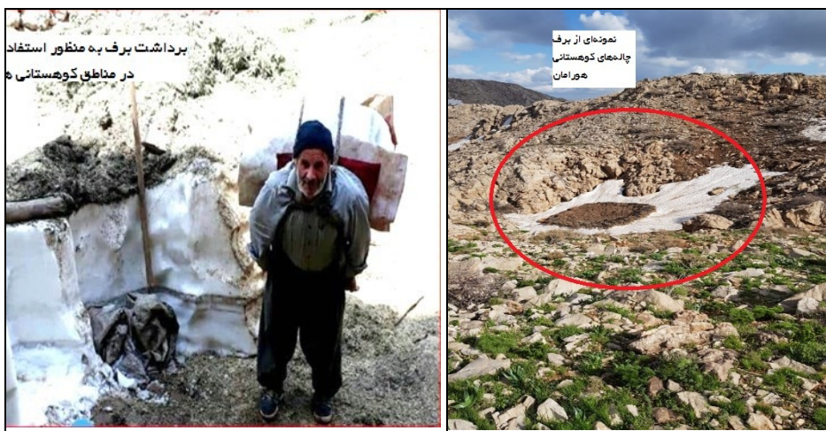
عکس ۲- نمونه برف چاله‌های کوه‌های منطقه هورامان.

جهت دام‌پروری کوچ می‌کنند. در آنجا هر خانواده دامدار برحسب تعداد دام‌ها از منبع آبی (برف) استفاده می‌کند. دسترسی سخت و نداشتن امکانات جهت توسعه برف چاله‌های بیشتر و ماندگاری بیشتر برف‌ها در چاله‌ها یکی از کمبودها و نیازهای دامداران امروزه منطقه است. نقطه قوت: مهم‌ترین و در دسترس‌ترین منبع آبی در ارتفاعات کوهستان برای دام‌پروری. نقطه ضعف: بسیار سخت بودن انتقال آب برف چاله‌ها به داخل سکونتگاه‌های موقت جهت مصرف خانوارها و دام‌ها.