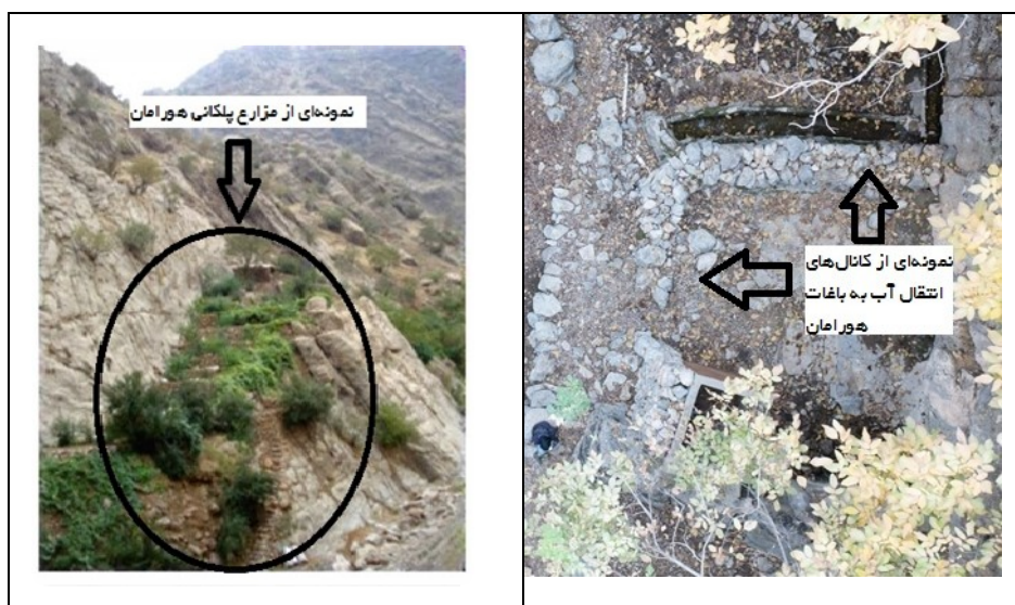
عکس ۸- جزئیات کانال آب‌ها و تراس‌بندی زمین‌های صخره‌ای برای انتقال آب و احداث باغ هورامان.

آب‌های سطحی و زیرزمینی را با تمام سختی‌های آن در یک محیط کوهستانی به سمت باغ‌ها انتقال داده و معیشتی مبتنی بر امور باغداری را به وجود آورده‌اند و برای قرن‌ها نقش پایداری در پویایی منظر فرهنگی هورامان داشته است (عکس ۸).