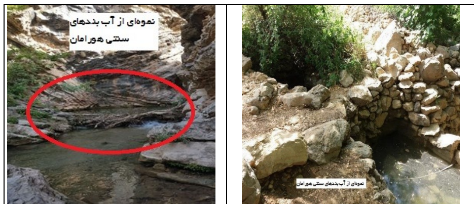
عکس ۵- آب‌بندهای سنتی منطقه هورامان.

۴-۱-۶- قنات: از آنجایی که اقلیم بخش عمده‌ای از ایران، خشک و نیمه‌خشک است، ایرانیان نیز از دیرباز درصدد بهره‌وری از پتانسیل‌های منابع طبیعی در راستای مواجهه با مسائل گوناگون به‌ویژه مسئله کمیابی آب و کم‌آبی بوده‌اند. از این‌رو، در هر منطقه با توجه به شرایط اقلیمی و زمینی، روش‌های خاصی را برای برداشت و مدیریت منابع آب ابداع نموده‌اند. یکی از کارآمدترین ابتکارات ایرانیان در این زمینه، قنات بوده است که