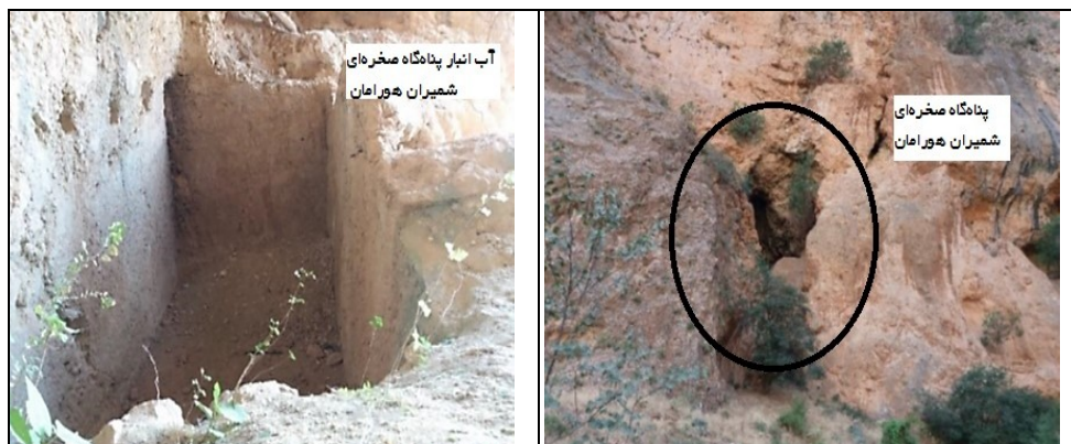
عکس ۴- نمونه پناهگاه‌ها و آب‌انبارهای منطقه کوهستانی هورامان (صادقی، ۱۳۹۷: ۴۸۲).

۴-۱-۵- آب‌بندهای بومی - سنتی: آب‌بندهای منطقه هورامان به دو صورت آب‌های سطحی رودخانه‌ها را مدیریت و کنترل می‌کنند. گاه نیاز است برای کنترل مسیر آب در رودخانه‌های که فشار آب زیاد است، جهت هدایت بخشی از آب به داخل جوی فرعی کنار رودخانه‌ها از آب‌بند استفاده شود و گاهی هم نیاز بوده است که آب را تا هنگام آبیاری ذخیره کرده، و با جمع شدن آب کافی در آب‌بندها، آب حفظ‌شده و آبیاری بهتری انجام می‌گیرد. این روش بیشتر زمانی کاربرد داشته است که یا آب کم باشد و یا زمین‌های بسیاری در مسیر آب باشند و حقایق شخیص محدود باشد. برحسب زمان ماندگاری به دو دسته موقت و دائمی تقسیم می‌شوند. الف - آب‌بند موقت یا یک‌ساله: این نوع آب‌بند با استفاده از دانش بومی با شیوه‌های متفاوت در منطقه هورامان با مصالح بومی ساخته می‌شود. بیشتر مصالح مورد استفاده در ساختن آب‌بند از مواد طبیعی مانند چوب، سنگ، شاخ و برگ درختان بوده است. ب - آب‌بند دائمی: کاربرد این نوع آب‌بند بیشتر در مسیر رودخانه‌های است که در فصل بهار و تابستان آب فراوانی دارد و فشار آب مانع استفاده از آب رودخانه می‌شود. بنابراین مردم با استفاده از یک آب‌بند محکم از مصالح سنگ و ملاط آهک، بخشی از آب را به سمت مزارع و باغات و حتی آسیاب‌های منطقه هدایت کرده‌اند (عکس ۵).