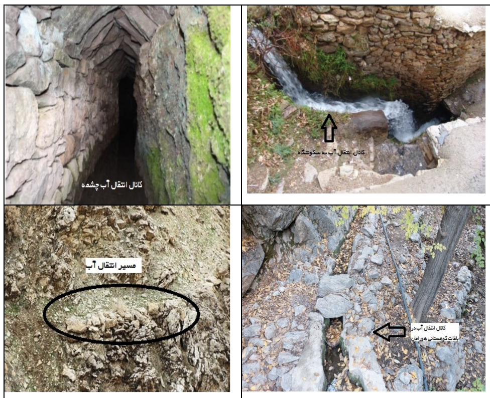
عکس ۱- کانال‌های انتقال آب در منطقه کوهستانی هورامان (نگارندگان).

۴-۱-۲- برف چاله‌ها، حوضچه‌ها و غارهای طبیعی ذخیره برف و باران: در منطقه کوهستانی و در ارتفاعات بلند هورامان، کمبود منابع آب و نبود چشمه‌ها موجب آفرینش ایده‌های مهم و درخور توجهی از گذشته تا عصر حاضر شده است. بنابراین مردمان منطقه هورامان بخصوص کوچ‌نشینان جهت رفع نیازهایشان از طبیعت، از دانش‌های بومی برای شناختن و بهره‌برداری از محیط‌زیست منطقه، استفاده کرده‌اند. در کوهستان‌های بلند و مرتفع منطقه هورامان به چند شیوه، از منابع آبی موجود در آن محیط، استفاده می‌شود. در فصل زمستان و بهار به دلیل حجم زیاد بارش برف و باران در کوهستان‌های هورامان تردد به آنجا سخت و گاهی غیرممکن است. با نزدیک شدن به