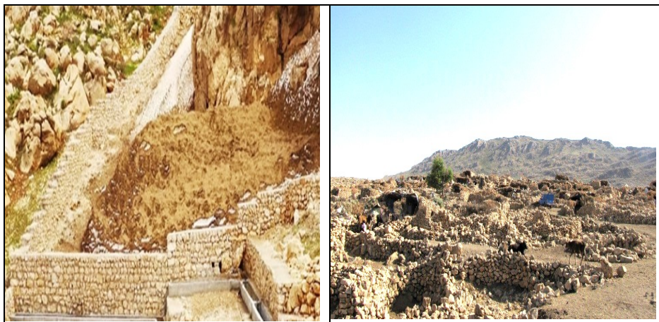
عکس ۹- جزئیات سکونتگاه هوار و منبع آب آن‌ها، چاله برف‌های منطقه هورامان.

۴-۳-۳- معیشت مبتنی بر آسیابانی: آسیاب‌های آبی منطقه کوهستانی هورامان، به واسطه ارتباط با معیشت و شیوه گردآوری غذا، از جمله بناها و ساختمان‌های خاص و با اهمیت در منطقه هورامان بودند. با توجه به منابع مرتبط با منطقه هورامان که در کتاب جغرافیای نظامی کردستان آمده است، به‌طور کلی کلیه کوه‌ها سنگی است ولی تمام پوشیده از جنگل و نقاط باصفا زیاد و آب در وسط کوه و دره‌های آن یافت و ملاحظه می‌شود. رودخانه‌های سیروان و رود حجیج در این منطقه مهم هستند و غیر این رودخانه‌های مهمی ملاحظه نمی‌شود فقط از بندهای وسط رشته‌های مختلف کوهستانی آب‌های جاری داخل سیروان می‌گردد هر آبادی و دهکده‌ای دارای آب مخصوص و رودخانه کوچکی است و در نقاط این آبشارها آسیاب‌های آبی به وجود آمده و استفاده دیگری از آن‌ها نشده است (رزم‌آرا، ۱۳۲۰: ۵۴). در بخش دیگر کتاب جغرافیای نظامی کردستان آمده است، در روستای دودان در منطقه هورامان «زراعت ندارند- توت- انجیر- انار زیاد دارد اهالی کسب و کارشان از باغداری و آسیاب خوبی دارند که در روز دو خروار گندم آرد می‌نماید» (همان: ۶۱).