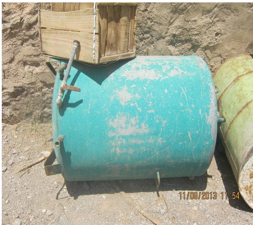
عکس ۹- کوره و بشکه (مرداد ماه ۱۳۹۲)

اسید جامد یا سنگ ترشی: برای دندانها ۱ رنگ، رنگ‌های غیر گیاهی استفاده می‌شود. نیل: ماده‌ای گیاهی است که فراوری شیمیایی روی آن انجام می‌شود. نیل آلمانی ثبات رنگ بالایی دارد.