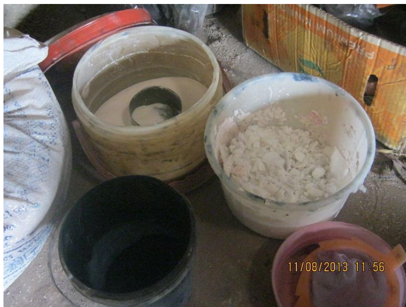
عکس ۱۵- مواد شیمیایی مورد استفاده.