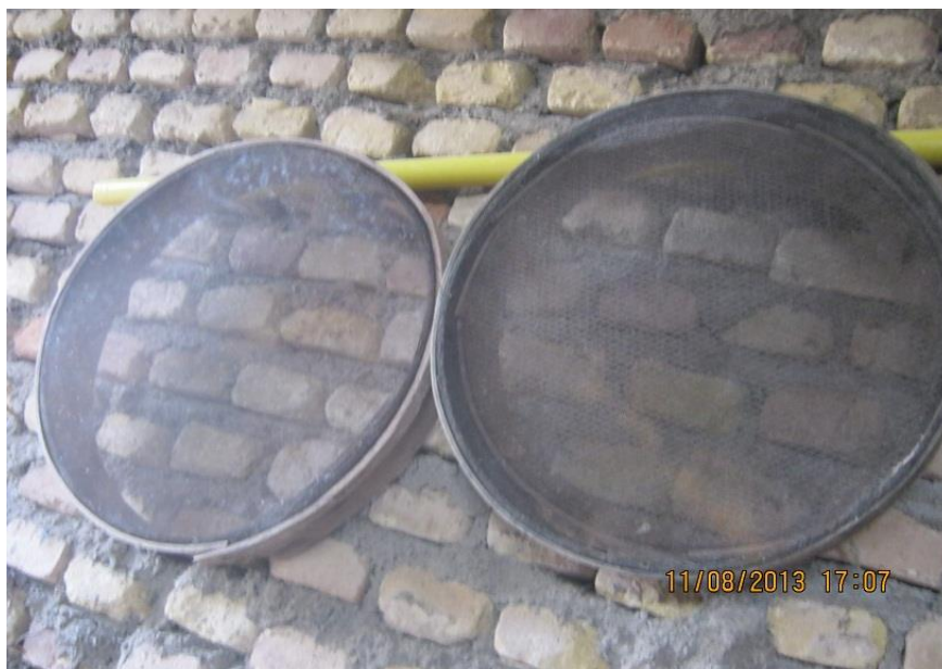
عکس ۱۸- دونمونه الک درشت و ریز. (نویسنده. مرداد ماه ۱۳۹۲)