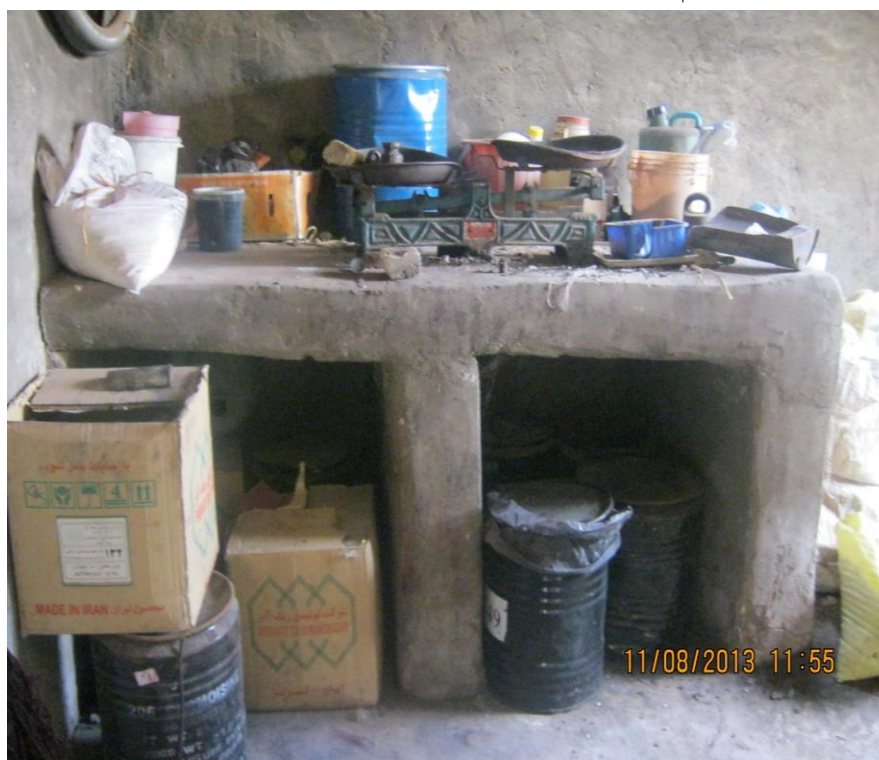
عکس ۱۴- نمایی از سکو یا میز کار و وسایل آن مانند ترازو و سرتاس... (نویسنده. مرداد ماه ۱۳۹۲)