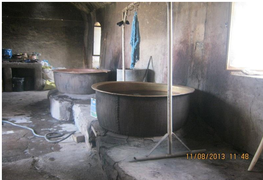
عکس ۱۲- سلابه: یا پایه که در بالای دیگ قرار می‌گیرد که نخ‌های رنگ شده را روی آن قرار می‌دهند. (نویسنده. مرداد ماه ۱۳۹۲)