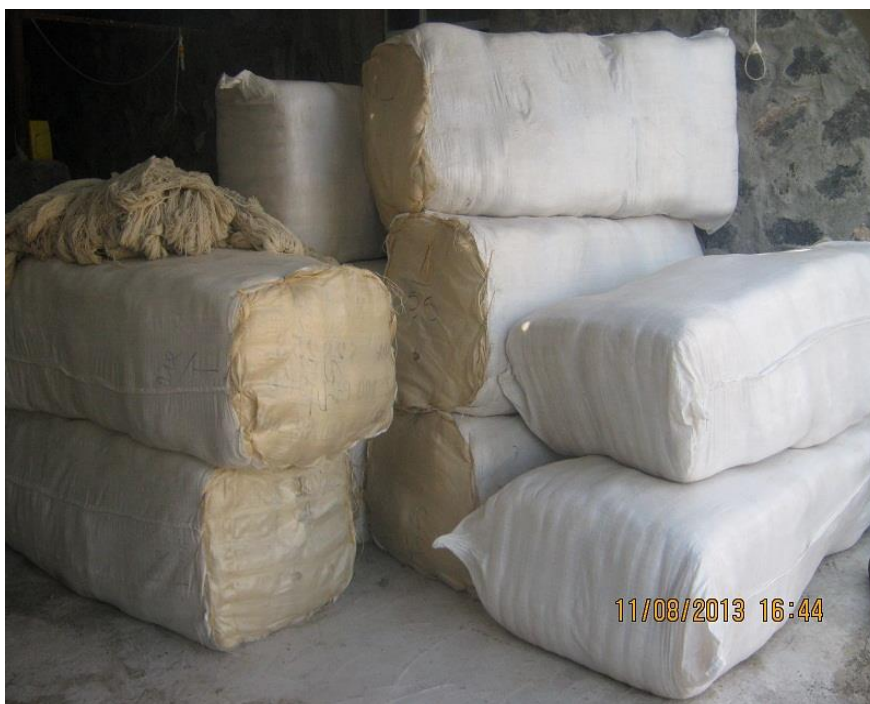
عکس ۴- عدل.

عدل: به بسته ۱۶ بقچه‌ای یا ۲۰ بقچه‌ای کلاف‌ها، عدل می‌گویند.