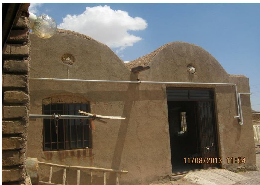
عکس ۲۲-نمای بیرونی کارگاه. (نویسنده. مرداد ماه ۱۳۹۲)