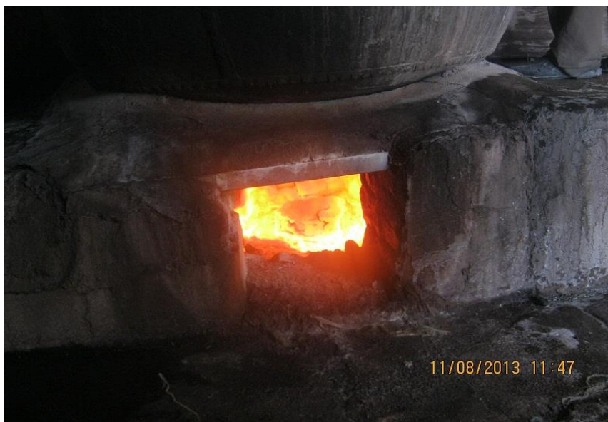
عکس ۱۱- مخزن آتش که با گاز شهری کار می‌کند. (نویسنده. مرداد ماه ۱۳۹۲)