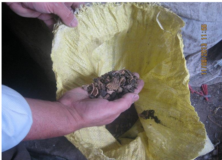
عکس ۱۶- پوست گردوی خشک شده. (نویسنده. مرداد ماه ۱۳۹۲)