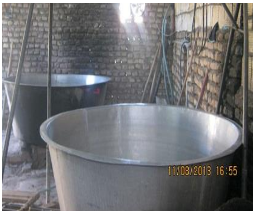
عکس ۸- پاتیل روحی. (نویسنده. مرداد ماه ۱۳۹۲)

دهانه ۱/۸۰ سانتی متر قطر بیرون: ۱۹۰ سانتی متر عمق: ۹۵ سانتی متر وزن: ۷۵ کیلو گرم گنجایش: ۲۷ کیلو گرم پشم از پاتیل روحی برای این که رنگ چرک نگیرد و پشم روشن نشان داده شود استفاده می‌شود. قارا: آب چکیده شده از ماست را که بجوشانیم پس از سفت شدن می‌شود قارا. در حدود ۱۰۰ سال پیش از قارا که همان قره قوروت است استفاده می‌شده است. در صورت نبود قارا از پوست لیموی آبگیری (ترش) استفاده می‌شده است.