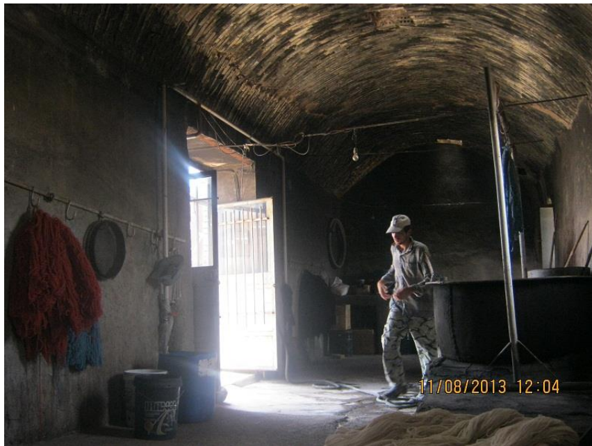
عکس ۱۷- نمایی از درون کارگاه و طاق ضریبی آن. (نویسنده. مرداد ماه ۱۳۹۲)