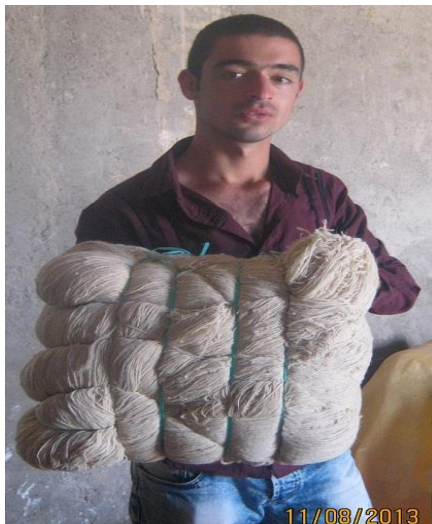
عکس ۳- بقیچه. (عکاس: نویسنده. مرداد ماه ۱۳۹۲)

بقیچه: واحد سنجش مقدار پشم در کارخانجات ریسندگی است که معادل حدود ۴/۵ کیلوگرم است. هر ۱۰ کلاف می‌شود یک بقیچه.