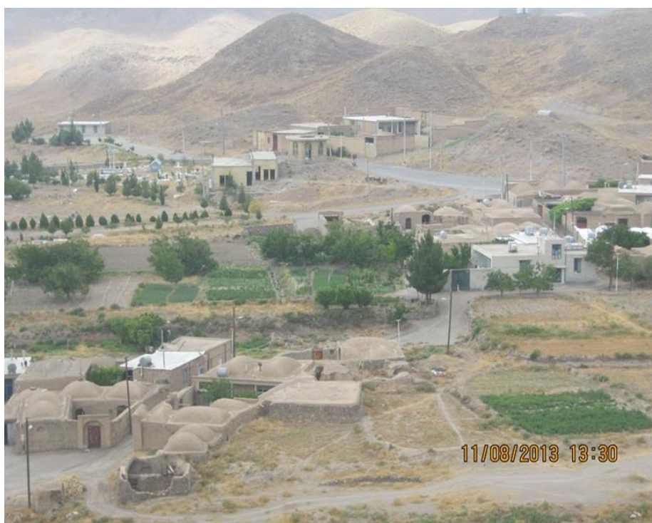
عکس ۱- نمایی کلی از روستای جشوقان. (مرداد ماه ۱۳۹۲)

روستای جشوقان بلحاظ کشاورزی محصول خاصی ندارد و از محصولات آن می‌توان از شلغم و انار نام برد. این روستا همان‌طور که از سر در مسجد جامع آن که متعلق به اواخر قرن دهم است، بر می‌آید در دوره صفویه محل زندگی گروه‌هایی از اشراف بوده که از آن جمله می‌توان به خاندان میر جلال الدین امیر اشاره کرد. امروزه جمعیت اصلی جشوقان تشکیل شده است از دو گروه سادات و عام؛ که ساداتها با نام خانوادگی بنی‌طبا شناخته می‌شوند. یکی از مشاغل مهم این روستا در گذشته رنگرزی سنتی بوده است