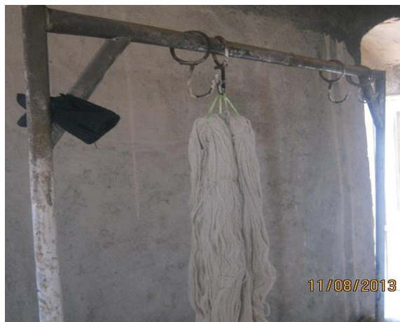
عکس ۲- کلاف (نویسنده. مرداد ماه ۱۳۹۲).

کلاف: ۲ دسته نخ می‌شود ۱ کلاف، که وزن آن حدود ۴۵۰ گرم است و هر ۱۰ کلاف می‌شود یک بقیچه.