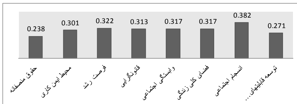
نمودار ۱- اندازه اثر رابطه ابعاد کیفیت زندگی کاری با تعهد سازمانی

با توجه به اطلاعات استخراج شده از نرم افزار (CMA2) ابعاد کیفیت زندگی کاری (حقوق منصفانه و کافی، محیط کاری ایمن، تأمین فرصت رشد، قانون‌گرایی در سازمان، وابستگی اجتماعی زندگی کاری، امنیت شغلی، فضای کلی زندگی، یکپارچگی و انسجام اجتماعی و توسعه قابلیت‌های اجتماعی) در رابطه با تعهد سازمانی دارای اثرگذاری متفاوتی هستند که این به معنای تأیید فرضیه H1 است و رد فرضیه H0 است که نتایج این آزمون در قالب نمودار (۱) ارائه شده است.