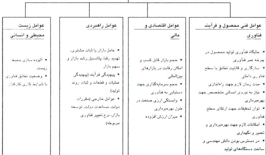
شکل شماره ۳: عوامل مؤثر در تصمیم‌گیری انتخاب منبع: [۹]