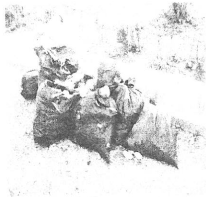
تصویر شماره ۱: تجمع آشغال