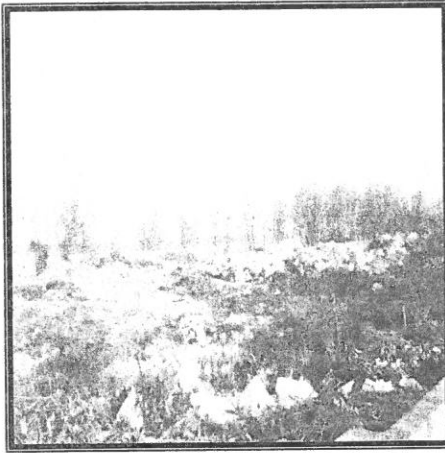
تصویر شماره ۴: اراضی رها شده در ساحل

(تصویر شماره ۳) و از طرف دیگر به صورت بایر رها شده است. (تصویر شماره چهار) که این موارد مغایر با اصول توسعه پایدار گردشگری است.