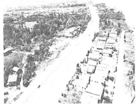
تصویر شماره ۳: تغییر کاربری زمین های ساحلی