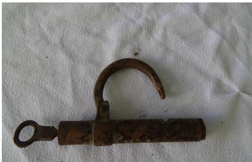
عکس ۷- قفل و کلید لوله‌ای