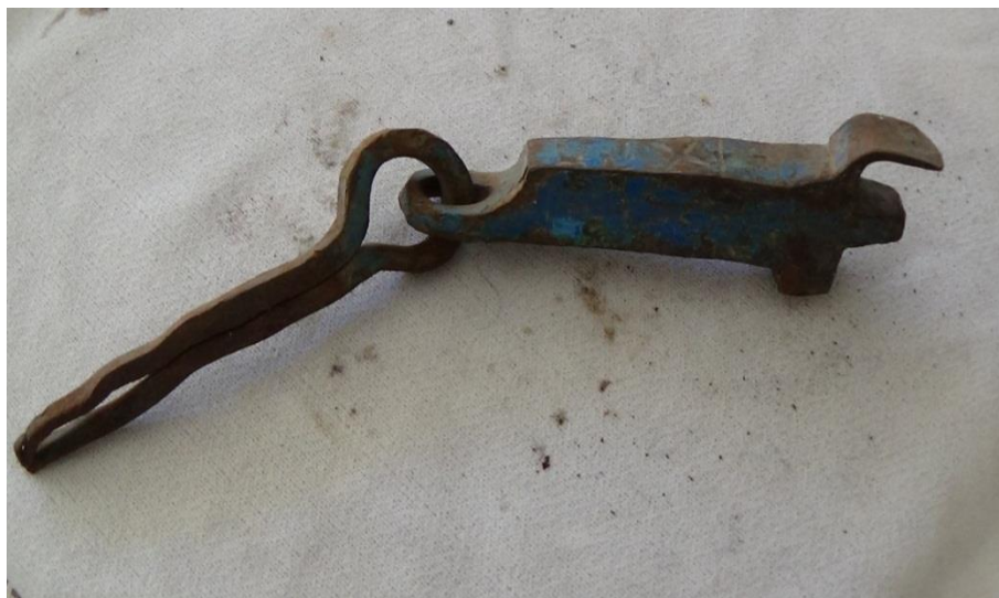
عکس ۴- دق‌الباب