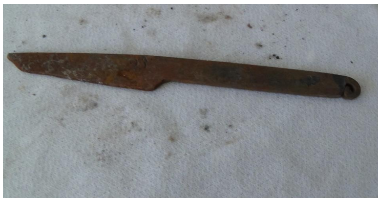
عکس ۲- کارد قالبیافی

این نظر و رویکرد در واقع درست بوده و صوفی محمد کار مردم شهر را روبه راهی کرده است. خوشبختانه بعضی از تولیدات صنعتی این هنرمند صنعتگر هنوز در اختیار نوادگانش قرار دارد که در ادامه بخشی از آنها نمایش داده می‌شود.