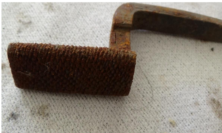
عکس ۳- سوهان چوب ساب