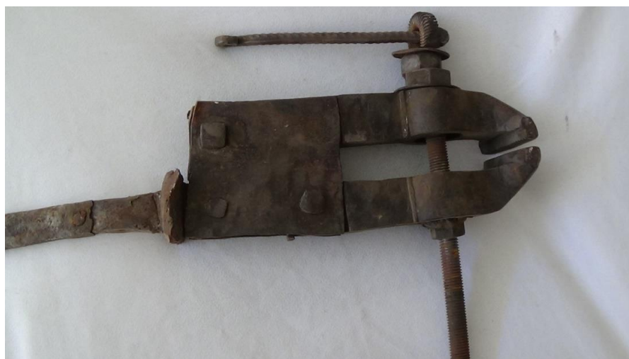
عکس ۵- گیره