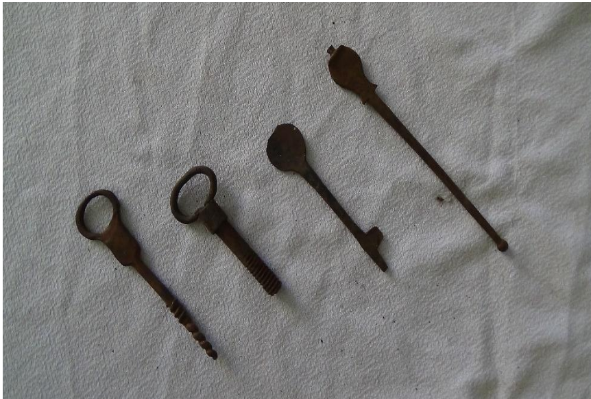
عکس ۸- انواع کلید