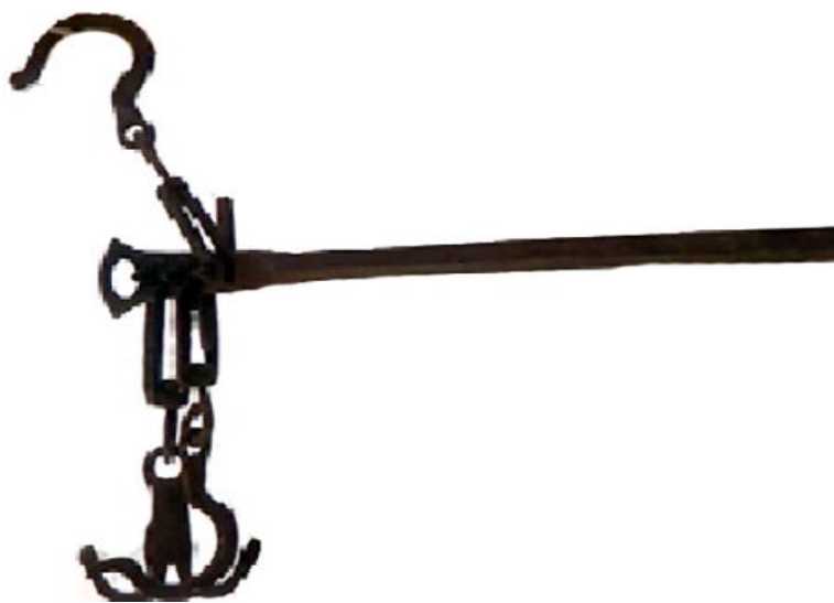
عکس ۶- قبان

ساخت اولین دست مصنوعی در غرب ایران ... ۱۷