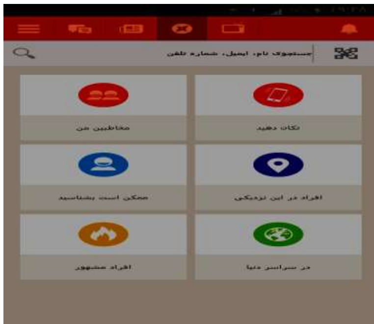
شکل شماره ۲: صفحه اصلی شبکه اجتماعی تانگو