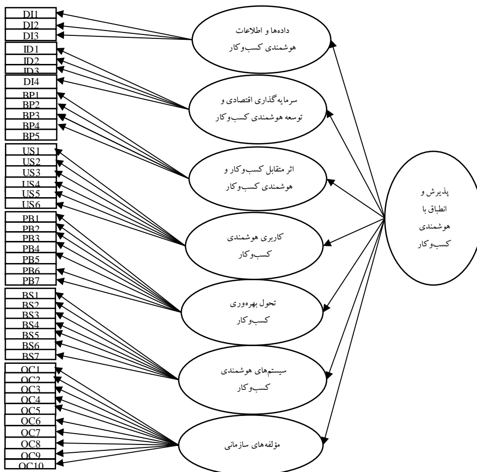
شکل (۱). مدل مفهومی تحقیق

به این ترتیب، در این تحقیق انطباق و پذیرش سازمانی هوشمندی کسب و کار ساختار چند بعدی است که دارای مدل نهفته ای با ۷ بعد است که هر یک دارای شاخص های خاص خود هستند. بر اساس بررسی ادبیات و پیشینه موضوع، مدل مفهومی این پژوهش به صورت شکل (۱) است.