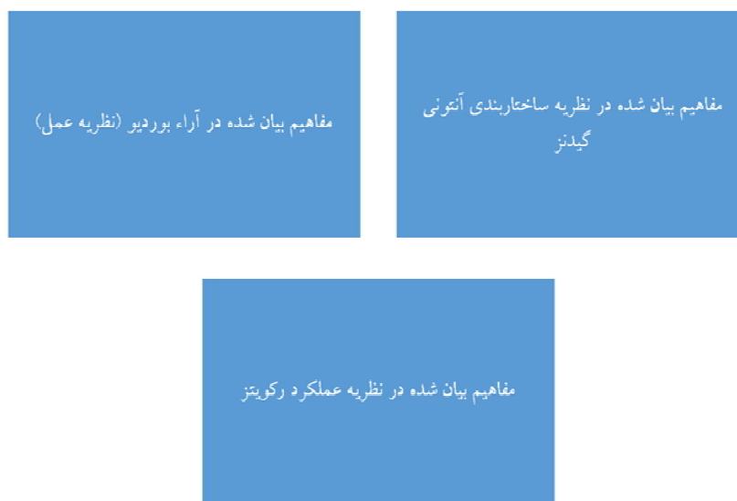
نمودار ۱- مفاهیم عمده راهنمای پژوهش

بدنی، شکل فعالیت‌های ذهنی، اشیاء ۱ و کاربردشان، دانش پیش زمینه‌ای در قالب‌های شناختی، راهکار و حالت عاطفی و آگاهی انگیزشی (هالکیر، ۲۰۱۱؛ هارگریوس، ۲ ۲۰۱۱). نظر به این که بررسی ادبیات نظری کمک به روشن شدن مفاهیم ساخته شده می‌نماید و هم چنین این نظریه‌ها حساسیتی را فراهم می‌آورند که در تفسیر داده‌های گردآوری شده کمک فراوانی می‌کنند، لذا با استفاده از مفاهیم به کار برده شده در چارچوب مفهومی به نظر می‌رسد که می‌توان برخی از مفاهیم تولیدی را بر اساس آن تدوین کرد. نظریه‌های عمل، اخیراً در مطالعات مصرف‌کننده، به عنوان یک امر امیدوارکننده ظاهر شده است که به جای تمرکز صرف روی ابعاد فردی مصرف‌کننده به سمت جنبه‌های ساختاری/جمعی مصرف هدایت می‌شود و درک مناسب‌تری از شیوه مصرف انرژی را فراهم می‌سازد.