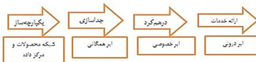
شکل ۲. نقشه راه استقرار رایانش ابری، (زو و کوانگ، ۲۰۱۴).

مراجعه‌کنندگان است، می‌تواند از ابر درونی یا همان ابری که خود کتابخانه ساخته است به صورت مستقل استفاده نماید (زو و کوانگ، ۲۰۱۴).